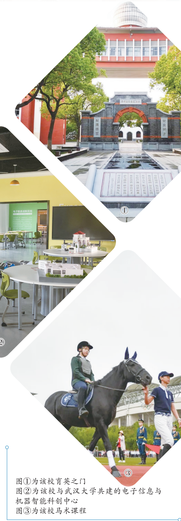
图①为该教育英之门 图②为该校与武汉大学共建的电子信息与机器智能科创中心 图③为该校马术课程

顶层架设，建立“丹心育人”教师书院。书院按照教师专业进阶式成长需求，开设朴茂班、弘毅班、卓越班，致力于营造浓厚学术氛围，倡导百家争鸣、学术自由的理念，为教师开展自主合作学习、研讨交流、实践探索、项目与课题研究等提供帮助，帮助教师突破各个成长阶段的瓶颈，力求让每一位教师由初职走向成