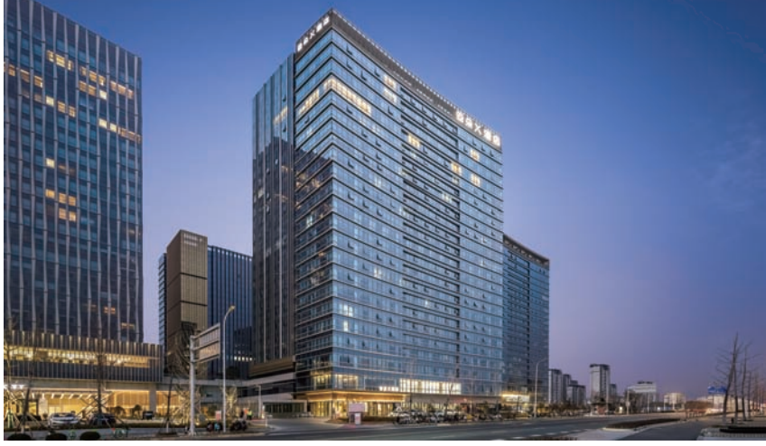
精品酒店成为城市品质考量“风向标”

当下,年轻人追求的“性价比”充斥着生活的方方面面。亚朵X酒店全屋智能配置,进入房间后直接呼叫“小度”就能实现灯光调控、窗帘开关……此外,还有24小时开放的洗衣房、健身房,300至