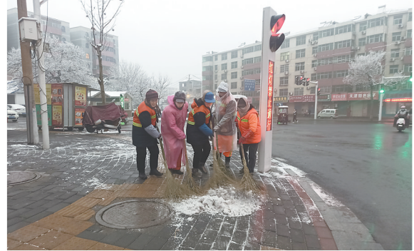
中站区环卫工人在冒雪作业。