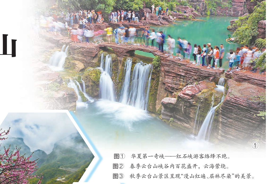
图① 华夏第一奇峡——红石峡游客络绎不绝。 图② 春季云台山峡谷内百花盛开,云海萦绕。 图③ 秋季云台山景区呈现“漫山红遍、层林尽染”的美景。

我想向世界推荐老家河南的云台山。众所周知河南拥有诸多历史名城,是当之无愧的文化大省,但我想告诉世界,河南的自然景观同样卓尔不群。云台山作为全球首批世界地质公园和国家AAAAA级风景区,因山势险峻,峰壑之间长年云锁雾绕而得名,拥有中原地区难得一见的丹霞地貌,是一个以太行山岳丰富水景为特色,以峡谷类地质地貌景观和悠久历史文化为内涵,集科学价值和美学价值于一身的科普生态旅游精品景区。云台山,四季浓淡总相宜,春来山花烂漫,夏至飞瀑流泉,秋日红叶似火,冬季银装素裹。此外,云台山素以拥有亚洲第一高瀑和华夏第一奇峡而闻名遐迩,可谓内涵与颜值并存。我在日本留学、工作已有7年时间,饱览过日本众多风景名胜,异国情调固然新鲜,但认为好山好水还要看中国。祖国的大国气质,不仅体现在幅员辽阔上,更体现在有大国担当上。2020年年初,面对突如其来的新冠肺炎疫情,中国的硬核抗疫表现让世界有目共睹。在全球疫情蔓延的严峻形势下,中国始终积极参与全球团结抗疫进程,尽己所能分享抗疫经验、提供抗疫援助。记得疫情发生初期全球防疫物资紧缺,中国驻日机构和河南老家的亲朋好友纷纷给我寄来口罩、药品,帮我度过了那段困难时期。更令我倍感温暖的是,随着这些物资而来的还有家乡的胡辣汤料、猪蹄、烩面,这些是我永远热爱的河南味道!李婉/口述 张 曦/整理