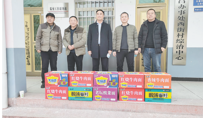
近日,工行焦作孟州支行积极履行社会责任,为当地农村送去防疫物资,关心支持坚守疫情防控一线的工作人员。

善作为的干部队伍,为“开门红”工作奠定坚实基础。 二是统一思想,凝聚转型发展新合力。提前召开动员大会,合理分配一季度经营指标任务,组织旺季营销业务培训,为“开门红”首战首胜提供精准破局。 三是全员上阵,干出提质增效新业绩。坚持高管带头、中层垂范,全员上阵、分层营销,形成众志成城、众人挑担的竞赛局面。 四是以贷引存,勾画普惠金融新蓝图。结合“党建+金融+乡村振兴”工作成果,以“金融快e贷”为开源不断丰富产品体系,打造小额贷款线上化,多措并举带动财政性存款和低成本存款稳定增长。 五是数字赋能,拼出科技金融新天地。全面构建以金融网点、自助银行、网上银行、手机银行、微信银行为主体的“五位一体”服务架构,引导客户线上办理业务,以科技之力深推普惠金融,全力保障基础金融服务。 六是筑牢阵地,开启暖心服务新征程。始终把优质文明服务作为行动准则,精心装扮布置厅堂,配齐纸巾热茶、充电设备、爱心座椅等便民设备,特别是针对老年人、残障人士等特殊人群,开辟金融服务绿色通道,以人性化的举措,提升金融服务温度。