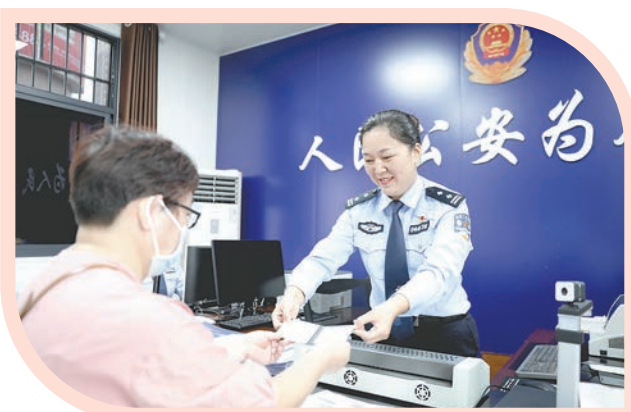
全市实施“一门通办”。