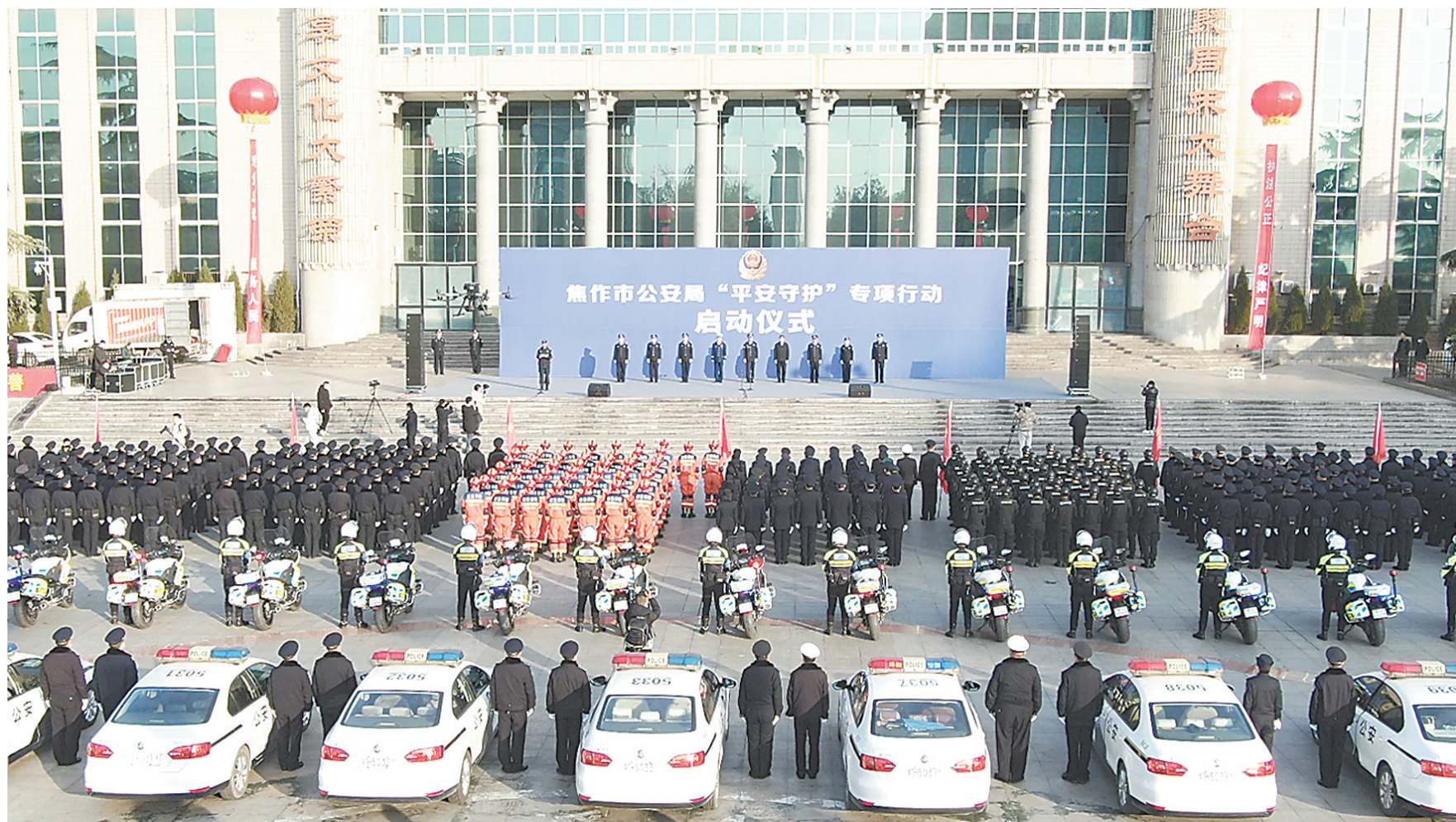
开展“平安守护”专项行动。

长期以来，全市公安机关以习近平新时代中国特色社会主义思想为引领，扛牢维护稳定政治责任，护佑百姓平安，护航经济发展，为全市改革发展稳定贡献了公安力量。当前，正值全市抗击疫情紧要关头，全市公安民警辅警挺身而出，身处抗疫最前线，表现出强烈的政治担当和过硬的能力水平。