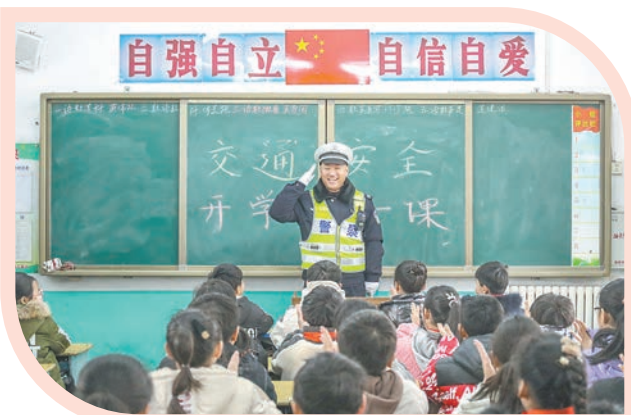
广泛开展交通安全“第一课”宣讲活动。