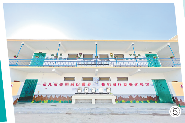
图① 博爱县柏山中学厕所外摆放的“柏山缸”。 图② 博爱县柏山镇义沟小学厕所内干净、整洁。 图③ 沁阳市西向镇中心小学厕所外观。 图④ 沁阳市第十五中学厕所外的文化墙。 图⑤ 武陟县圪垱店小学的“厕所楼”。

不觉中发生了改变。 立德树人教育之本，亦是育人永恒的主题。如今的校园厕所，也成了锻炼学生不怕吃苦、热爱劳动的新场所。