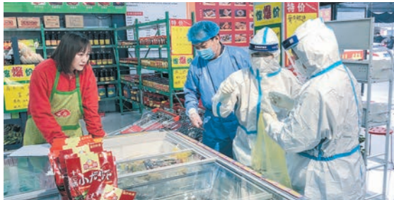
督导检查冷链食品重点环节的疫情防控工作。