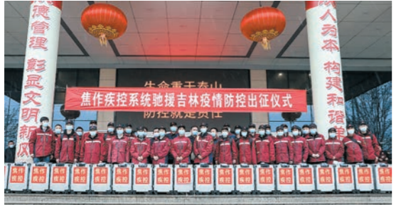
焦作市疾控中心驰援吉林疫情防控出征仪式昨日举行。