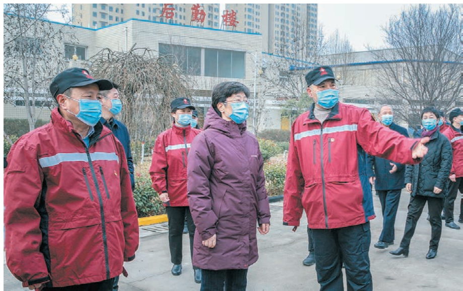
市委书记葛巧红春节前到市疾控中心看望慰问干部职工。