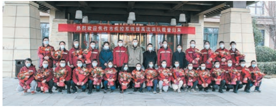
焦作市疾控中心援流调队凯旋归来。