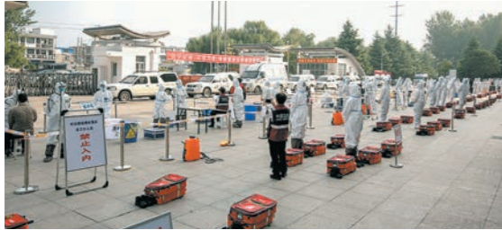
焦作市疾控中心开展疫情防控演练。