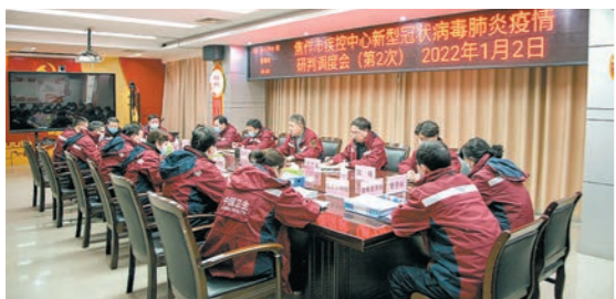
焦作市疾控中心新冠肺炎疫情防控工作研判调度会。

全省疾控工作2021年共计17项业务考核指标,该中心全部进入先进行列。其中,10项业务考核指标位列全省第一(地方病防控、寄生虫病防治、重点传染病防控、疫情信息管理、卫生应急、学校卫生、流感监测管理、空气雾霾监测、实验室质量控制、新冠疫苗接种),践行“有一必争、逢冠必夺”铮铮誓言;7项业务考核指标位于全省先进行列受到表彰(职业病防治、艾滋病防治、结核病防治、病媒生物防制、营养卫生、环境卫生、食品安全风险监测),获得了河南省工人先锋号等省、市级荣誉22项。