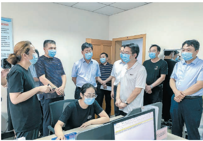
市委副书记、市长李亦博到市疾控中心调研疫情防控工作。