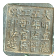
明宣德炉底部铭文。

这尊宣德炉通耳高27厘米，口径37.5厘米，足距28厘米。直口，沿微外撇，沿上附有对称双耳，短颈、鼓腹、圈底、三锥足，底部有铭文“宣德年制”，体大完整。武陟县博物馆工作人员介绍，虽然是清代仿制，但这尊宣德炉铸造技艺同样高超，具有收藏价值。