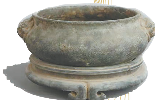
另一尊宣德炉。