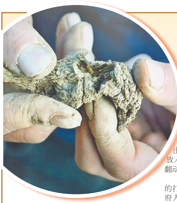
焙过的熟地黄。