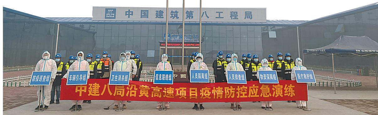
↓近日,中建八局沿黄高速项目三标段开展疫情防控应急演练。