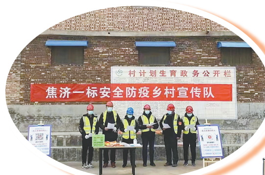
↑河南省公路局集团沿太行高速一标项目经理部安全防疫宣传队员在宣传疫情知识

(即:消毒管理规定、测温管理规定、餐饮管理规定、会议管理规定、个人防护规定)做好项目经理部的疫情防控工作。 中交路建沿黄高速武陟至济源段2标项目部认真落实属地责任,按照疫情防控要求,积极部署疫情防控工作,认真开展全员摸排和疫苗接种工作,安排专人提前储备防疫物资,认真落实人员管控措施。目前,项目经理部53人全部接种新冠肺炎疫苗,累计进行核酸检测7次。 中建八局沿黄高速武陟至济源段3标项目部近日开展疫情防控应急演练活动,演练分防疫巡视组、车辆引导组、卫生消杀组、人员隔离组、物资保障组、医疗救护组6个小组,项目部40多人参加此次活动。通过演练,该项目部全面落实“及时发现、迅速处置、精准管控、有效救治”的防控措施,达到了预期目的和效果。