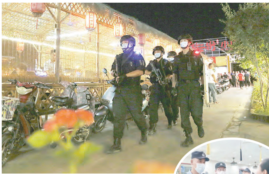
▲近日,市公安局特警支队民警在夜市周边巡逻。 本报记者 王梦梦 摄

目前,全市公安机关全面开展安全隐患排查行动、“警灯闪烁”巡逻行动、打击违法犯罪专项行动,牢记使命、忠诚履职,用实实在在的工作成效,不断增强人民群众的获得感、幸福感、安全感,为党的二十大胜利召开创造更加稳定的社会治安环境。