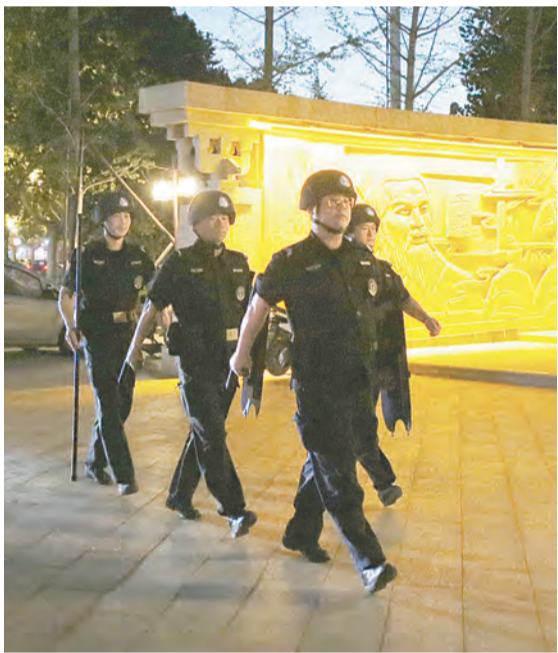
近日,温县公安局民警夜间在子夏公园巡逻。

连日以来,市公安局解放分局在夜市等人员密集区设置“夏季治安服务台”,随时接受群众报警求助。