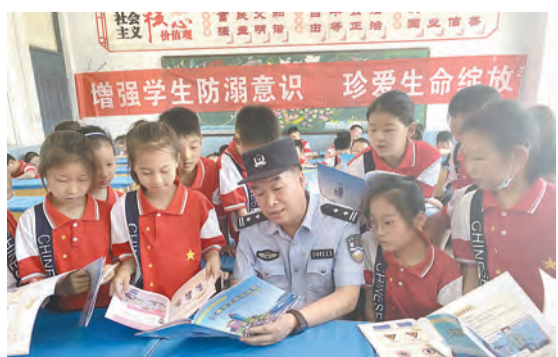
近日,市公安局解放分局民警深入辖区小学,开展夏季防溺水安全教育宣传活动。