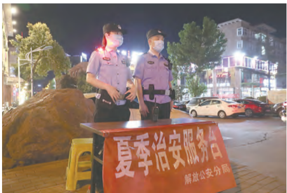
连日以来,市公安局解放分局在夜市等人员密集区设置“夏季治安服务台”,随时接受群众报警求助。