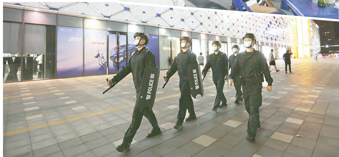
近日,市公安局特警支队民警夜间在万达广场周边进行巡逻。