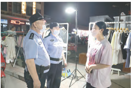
近日,市公安局中站分局民警夜间向群众进行治安防范宣传。 本报记者 杜挺勇 摄