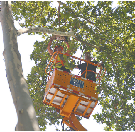
工作人员利用特种作业车高空修剪树枝。

本报讯（记者赵改玲）汛期即将来临，防患于未然。6月16日、17日两天，市干休所、市园林绿化中心绿化队联合大修了“红军院”里的法国梧桐树，清理安全隐患多处。“红军院”其实就是焦作市干休所小区大院，里面曾住有老红军、抗日战争和解放战争时期的老干部74名，院里共有10棵法桐，树龄都有50岁左右，长得高大葱郁、生机勃勃，最高处有五六层楼高。但由于多年没有修剪过，存在一定安全隐患，尤其是在汛期即将来临之际隐患更为明显。为了小区群众和老干部们的安全，市干休所向市园林绿化中心打报告，反映这里的5棵法桐需要修剪。6月16日，市园林绿化中心绿化队应急抢险班18名工作人员出动3辆特种作业车冒着酷暑来到小区。他们严格按照作业要求，对弱质、病质的法桐进行“抢救”，对离居民楼较近、影响楼顶安全的病枝、枯枝、垂枝等进行修剪和清理，排除了安全隐患。