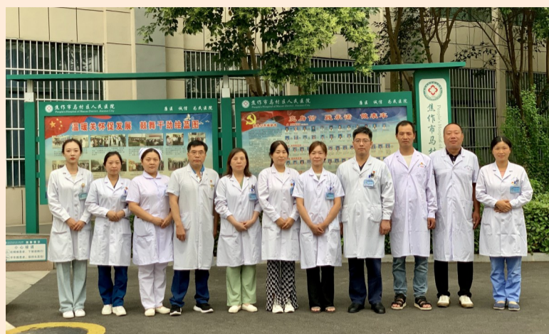
马村区“好医生”群像。