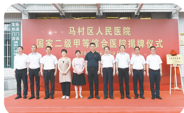
2021年6月29日,马村区人民医院二级甲等综合医院揭牌。