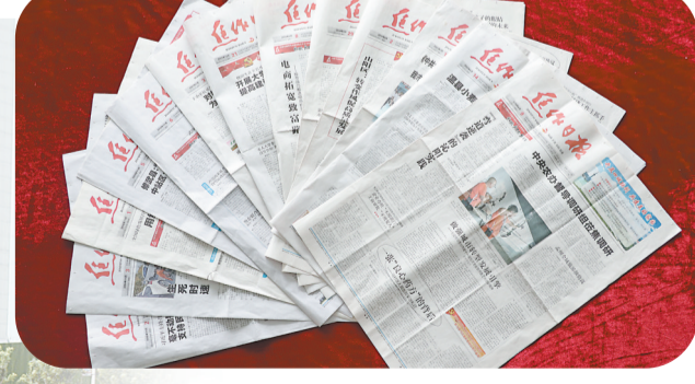
马村区人民医院珍藏的焦作日报。