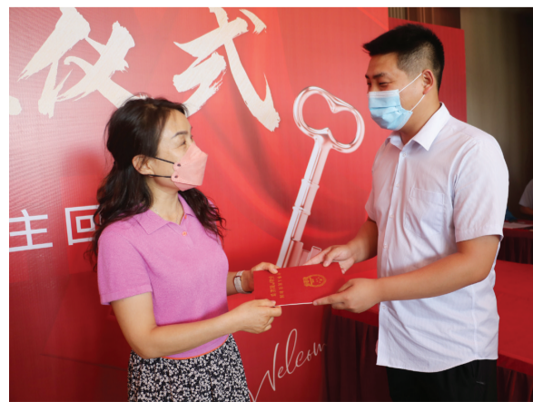
业主从工作人员手中接过不动产权证书。

目前,多个“交房即发证”试点项目在我市陆续实施,更多便民服务都在积极推进中,市不动产登记中心将加强部门联动,完善方案流程,让更多业主在前置手续齐全的前提下,享受到“交房即发证”带来的便利。