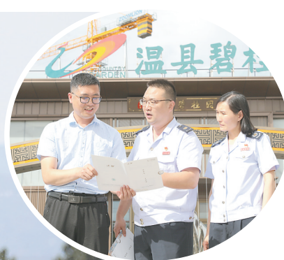
▲近日,温县税务局开展“聚焦急难愁盼 助企轻装上阵”专项行动,精准掌握纳税人缴费人需求,点对点送“春风”、一对一做辅导,强化税企互动,推进精细化税费服务,不断优化税收营商环境,为企业发展加油添力。