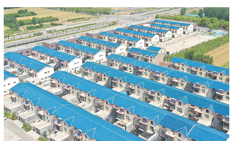
6月28日,记者在马村区武王街道泰庄新村拍摄的整齐的居民新居。由于为东海大道建设“让路”,泰庄村在村北侧打造了3万平方米的泰庄新村,这里集纳健身广场、文化舞台等,水、电、气、路和监控、绿化等设施齐全。行走在泰庄新村,只见一幢幢小洋楼整齐划一,一条条宽阔平整的道路贯穿其中,节能路灯有序排列,构成一幅幸福和谐的乡村新画卷。

本报讯 (记者王爱红) “家里安装了护理床,我们还学会使用马桶助力架、感应小夜灯、助浴椅等,现在可比以前方便多了。”每每说起适老化改造了充分的宣传培训,对各个街道进行政策指导和专业培训,并以辖区高龄低保老人为重点摸排对象,先后逐户上门走访300余人,充分了解老人的需求,做到了重点摸排不遗漏、广泛宣传全覆盖。在改造过程中,该区民政局积极协调、全程跟进,针对老年人提出的个性化需求,推出“一户一策”,精准对接,做到了让老年人满意、放心。 目前,该区已在全市率先完成260余户的适老化改造。