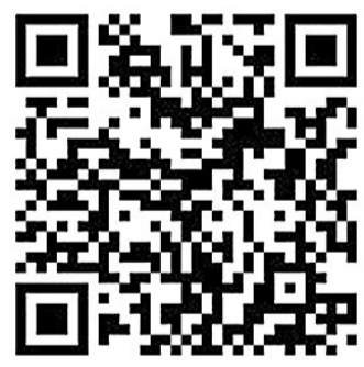
(扫码看政企对接会第七期精彩回放)