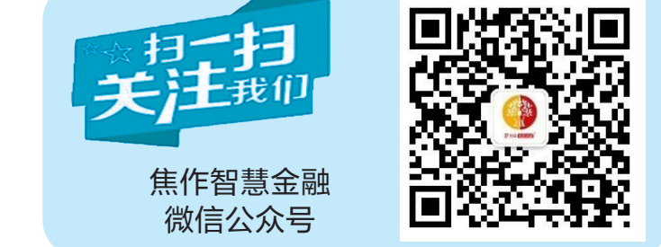
焦作智慧金融 微信公众号