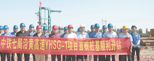
本报通讯员 段玉明 摄

6月24日，由中铁七局承建的沿黄高速武陟至济源段项目一标二辅营枢纽B匝道2号桥首根桩基顺利开钻。 本报通讯员 段玉明 摄