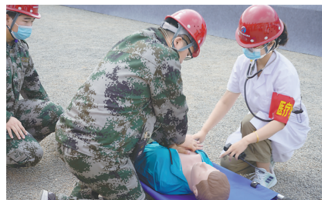
抢险救援组在对伤者进行抢救。

本报讯（记者段美如）“因连续降雨，沿太行高速一标大沙河大桥项目发生险情，请第一、第二应急抢险队立即赶到现场，迅速开展抢险救灾工作。”为深入学习贯彻习近平总书记关于安全生产工作的重要论述精神，落实中央、省委、市委关于“防大灾、度大汛、抢大险”工作重要部署，切实提高高速公路建设者应急处突能力和防汛应急救援能力，6月29日上午，由市高速公路建设指挥部联合河南焦源高速公路有限公司开展的2022年焦作市高速公路建设项目防汛抢险应急演练活动在沿太行高速公路焦济段一标大沙河大桥举行，约120余名干部职工参加了应急演练活动。