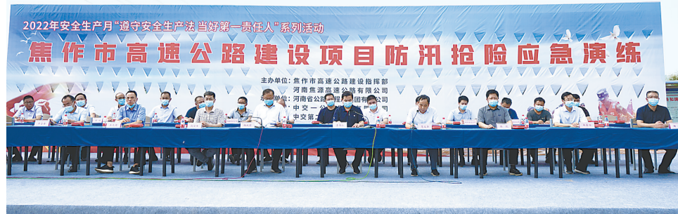
焦作市高速公路建设项目防汛抢险应急演练现场。

据了解，为有效保障汛期安全，高速公路各项目部均配备了大型机械设备用于汛期值守，全线共有推土机10台、装载机10台、吊车6台、挖槽机11台、自卸车18台、运输车辆30台等。此外，参与项目建设的各种大型机械设备500余台和各工种施工人员1000余人也作为储备力量，随时听候调遣，按需求参与应急抢险救援工作。