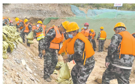
抢险应急组在争分夺秒搬沙袋对堤坝进行加高加固。