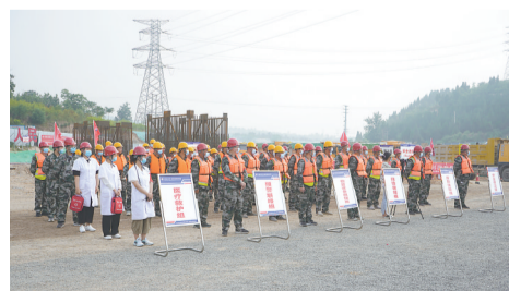
6个应急小组集结完毕。