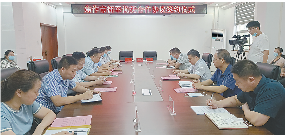
双方拥军优抚合作协议签约仪式现场。