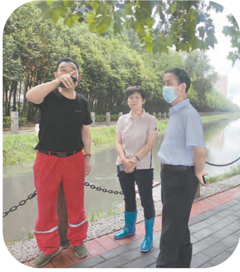
↑督导组在黑河进行安全排查。