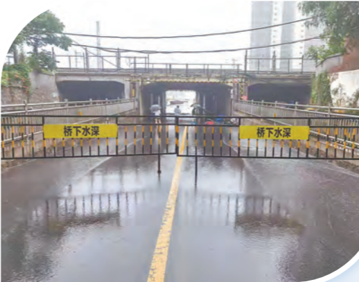
及时封堵积水铁路立交桥。