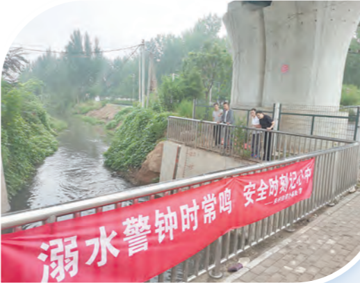
认真观察河道水情。