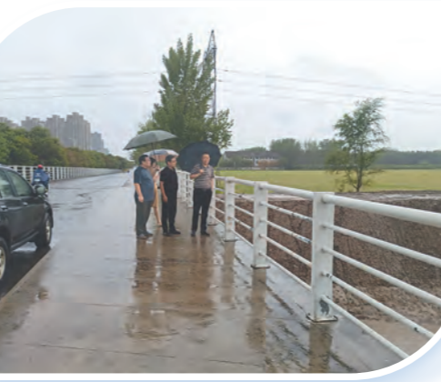
督导示范区防汛工作。