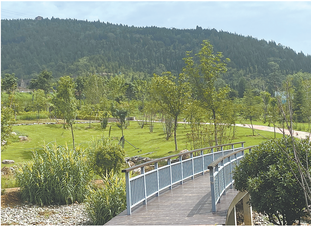
近年来，我市以南太行森林公园建设为龙头，先后实施国家南太行山水林田湖草生态保护修复工程、环城森林公园建设工程，全力打造南太行生态旅游集聚带。图为南太行·花海广场一角。