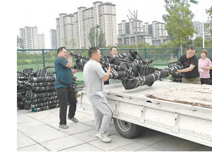
7月15日,沁阳市体育运动发展中心工作人员将健身器材装车。该中心为沁阳市45个行政村配发的45套270件、价值45万元的健身路径器材,于当日全部发放到位。

本报讯(记者韩静淼)近日,温县黄河街道紧紧围绕“五星”支部创建这个中心,通过“抓引领、带路子,抓学习、带提升,抓谋划、带水平,抓示范、带干劲,抓推进、带效能”,上下联动,协同驱动,保障创建工作有力有序开展。 高位高标抓引领、带路子。黄河街道党工委充分发挥旗帜引领作用,坚持舵手指挥、统揽全局;六次召开创建工作专题部署推进会,引领各村切实把“五星”支部创建作为当前和今后一个时期强化基层治理的重要载体和抓手,将思想认识凝聚到创建目标上来,将各方力量汇聚到工作任务中去,通过深入领会实践,狠抓贯彻落实,确保创建工作方向正、内容实、目标明、效果好。 毫不松懈抓学习、带提升。“五星”支部创建标准高、涵盖广,怎么去抓?如何创优?立足提升工作水平,该街道不失任何一次学习机会,组织各级干部认真学习培训班、大讲坛等各类线上学习活动;党工委负责人先后两次为各村“两委”干部作专题辅导报告。在此基础上,组织带领各村党支部书记和工作专班,就“五星”支部创建的好机制、好做法、好经验,到先进县(市、区)实地观摩,现场感悟、取经问道,确保学以致用。 育强补弱抓谋划、带水平。紧盯创建标准,依托自身实际,该街道不断下沉班子力量,指导各村反复研判创建计划和目标,在党支部建设、产业布局、社会治理等方面量身制定紧贴实际的创建规划,制定行之有效的推进措施,让各村的主导优势更加凸显,创“星”之路更加顺畅,使“五星”支部创建工作更有依据、定有标尺、干有方向、进有目标。 以点拓面抓示范、带干劲。集体经济的领头雁地位怎样巩固壮大?红色阵地的排头兵优势如何延展发挥?该街道主要领导化身服务员,为冷链物流园、雪菜种植加工、怀药产业基地建设等创建工作把脉定向、献策出招,用全身心投入激发基层争“星”进位的斗志,为“五星”“四星”创建村寻求产业突破锦上添花,为“三星”创建村实现工作再进位鼓劲加油。 捆绑作战抓推进、带效能。为高质量完成“五星”支部创建工作,该街道采取“支部一级抓一级,支部一根主线,科室、站所左右集成”的捆绑作战模式,建立“周一周末两汇报、月初月尾两总结、观摩打磨齐跟进”工作机制,及时总结复盘创建工作进展情况,分析存在问题,拿出整改举措,以常态化督查手段,抓好工作落实,通过以周保月、以月保季、以季保年,确保创建工作目标如期完成。