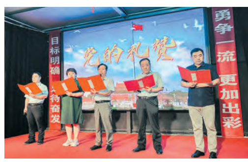
市土地收购储备中心相关领导深情诵读《党的礼赞》。

本报讯(通讯员靳秋、陈彦红)为迎接党的二十大胜利召开,奏响时代爱国华章,7月29日,市土地收购储备中心联合市盛通地产经营有限公司,举行“悦读新思想 喜迎二十大”经典诵读比赛。15时30分,在庄严的国歌声中拉开了“悦读新思想 喜迎二十大”经典诵读比赛的帷幕,各位参赛选手紧紧围绕“悦读新思想,喜迎二十大,奋进新时代,永远跟党走”主题,通过诵读的方式传承红色基因,永葆初心使命。“中国梦,反映了近代以来一代又一代中国人的美好夙愿,进一步揭示了中华民族的历史命运和当代中国的发展走向,指明了全党全国各族人民共同的奋斗目标……”市盛通地产经营有限公司代表队第一个上场,选手激情澎湃的诵读得到全场观众的热烈掌声。“您用鲜血涂抹了新中国的黎明,您用火光照亮我们前进的征程,您用镰刀割断了黑暗的历史,您用锤子砸碎了腐朽的铁门……”市土地收购储备中心代表队深情诵读《党的礼赞》,将比赛气氛推向了高潮。整场比赛中,各支参赛队伍精心准备诵读文章的同时,打破传统诵读模式,将歌曲、舞蹈、情境等元素融入诵读中,创新诵读模式,让听觉盛宴变得有声有色。选手们真挚的情感,宣传习近平新时代中国特色社会主义思想,歌颂祖国发展变化、赞美中华儿女奋勇拼搏精神,时而慷慨激昂,时而深情款款,将一段段诗词文章演绎为生动优美的画卷,带领全场观众感受新中国成立以来伟大祖国翻天覆地的变化,传递时代最强音。现场评委从诵读、音乐、现场表现力等多方面进行综合评比,各队选手经过激烈的角逐,市盛通地产经营有限公司办公室代表队从11支队伍中脱颖而出,在本次比赛中荣获一等奖。通过本次“悦读新思想 喜迎二十大”经典诵读比赛,提升了所有人员的凝聚力,进一步坚定理想信念,激发政治担当,以新动力助推新发展,以优异的成绩迎接党的二十大胜利召开。