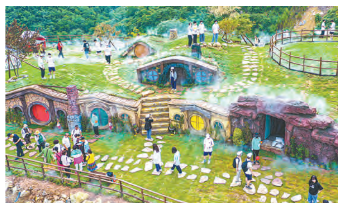
清凉一夏,甜蜜有你!青龙峡最大网红“甜心小屋”浪漫上线。

网红童话秘境“甜心小屋2.0”浪漫上线!独特的梦幻童话场景和美好的爱情寓意,吸引周边众多游客前来打卡拍照,体验山野间的“秘境乐园”,同时公主魔法表演每周末开启,成为周边亲子游、夏日