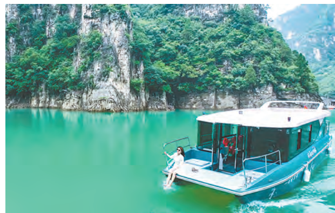
乘翡翠天池悠悠游船,感受爱情圣地绝美浪漫风光。