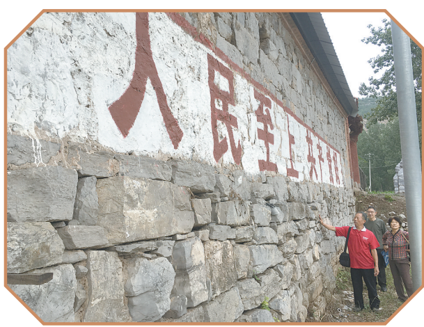
位于艾曲村的修武县抗日民主政府筹备地。