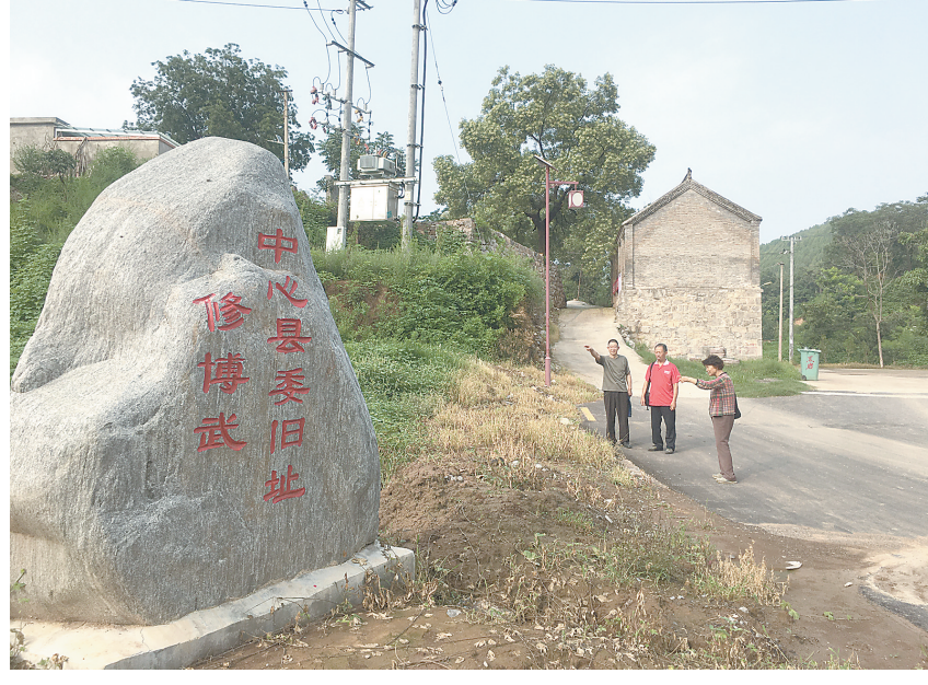
位于黑岩村的修博武中心县委旧址。

在修武县抗日民主政府的领导下，道清游击队由最初的20多人，迅速发展至1000余人，在抗日斗争中有力地配合了国民党95师作战，以及后来太