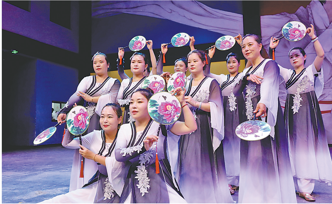
→修武县七贤镇“七贤大戏台”的演出由乡镇组织、群众出演，深深植根于百姓中间。