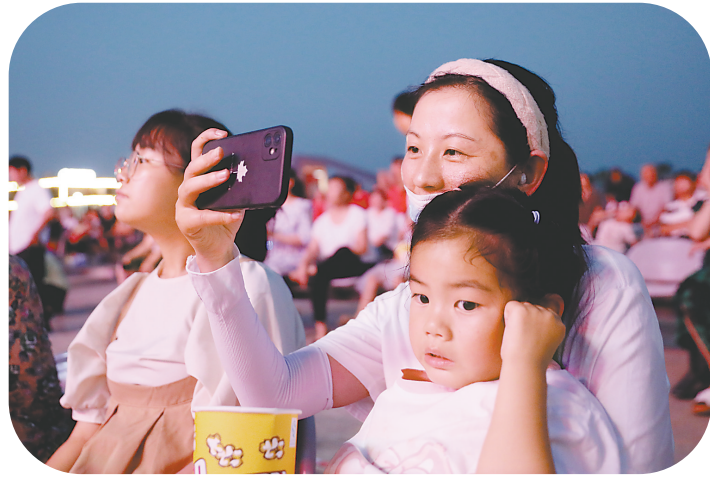
↑每当“七贤大戏台”有演出，周边群众都踊跃前来观看。