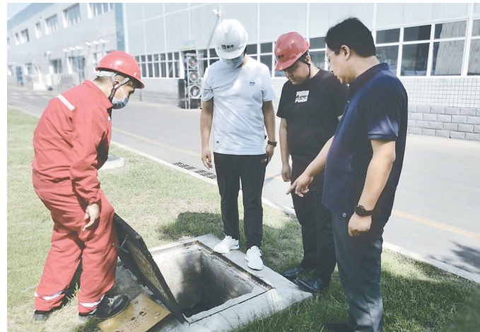
昨日,蒙牛乳业(焦作)有限公司的员工在检查厂区排水井。这是该公司开展防汛应急演练的一项内容,通过演练持续提升广大员工的防汛应急抢险能力。

本报讯(记者付凯明 通讯员秦敏)8月10日下午,示范区纪委监委组织召开全区纪检监察系统以案促改警示教育大会,深入学习贯彻河南省、市纪检监察系统以案促改警示教育会议精神,安排部署相关工作。区领导刘春明出席会议。会议通报了2018年监察体制改革以来全市纪检监察干部违纪违法情况,学习了《全区纪检监察系统“自我革命铸铁军 坚决防止灯下黑”以案促改工作方案》。为切实加强纪检监察干部的教育管理,所有参会纪检监察干部现场签订了《焦作市纪检监察干部严守“五条禁令”争做“四个绝对”监察承诺承诺书》,参加了《中华人民共和国监察官法》应知应会知识测试。会议要求,要提高政治站位,认真对照检查,加强队伍建设,持之以恒打造绝对忠诚、绝对纯洁、绝对过硬、绝对可靠的纪检监察铁军。