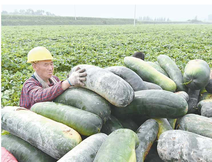
8月14日,沁阳市柏香镇高村农民正在装运黑皮冬瓜。近年来,已有20年冬瓜种植历史的柏香镇,采用“合作社+基地+农户”管理模式和“麦瓜间作套种”种植模式发展黑皮冬瓜种植。今年,该镇“麦瓜间作套种”面积达2666.7公顷,两万农民依托冬瓜种植实现持续增收。

截至目前,该镇累计出动人员330人、车辆19辆,清理乱堆乱放27处,清运垃圾26吨。