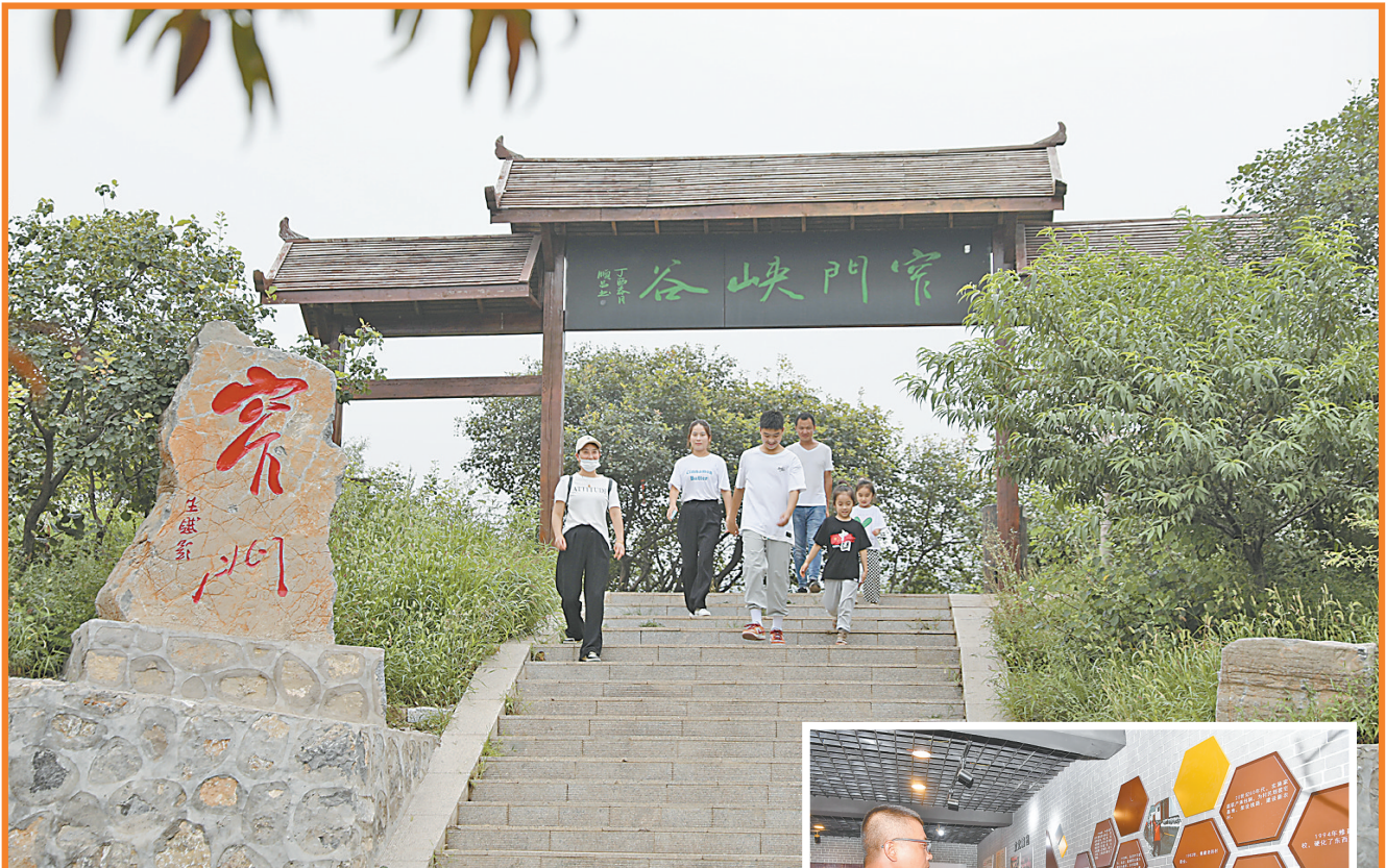
↑8月21日，许多市民来到位于中站区龙翔街道赵庄村的窄门峡谷，徜徉山水之间，度过愉快星期日。

本报讯（记者李英俊 通讯员贾黎明、邹晓强）“五星”支部创建工作开展以来，孟州市槐树乡汤王庙村党支部深入谋划、稳步推进，确保“五星”支部创建工作走深走实。 争创“支部过硬星”。该村充分发挥党支部战斗堡垒作用和党员先锋模范作用，探索建立“党员十联”工作机制，党员为群众提供“面对面”“全覆盖”“零距离”的网格化服务，助推中心工作落实落细。 争创“产业兴旺星”。该村围绕“一村一品”产业发展格局，引导村民种植苹果、软籽石榴、小杂粮等共34公顷。 争创“生态宜居星”。该村聘请专业团队进行整体规划，统筹推进户厕改造、垃圾污水治理、村容村貌提升等工作，栽植树木4000余棵，将5处“空心院”整治为小游园、小菜园、小花园。 争创“平安法治星”。该村以“三零”创建为契机，建成“平安一条街”，加强对群众的法制宣传；实行干部包片、党员联户制度，认真开展走访排查，将问题解决在萌芽状态，确保小事不出村。 争创“文明幸福星”。该村充分发挥“一约四会”作用，不断加强精神文明建设，持续开展“美丽庭院”“美丽汤店人”和“孝顺媳妇”等评选活动，形成了良好的村风民风。