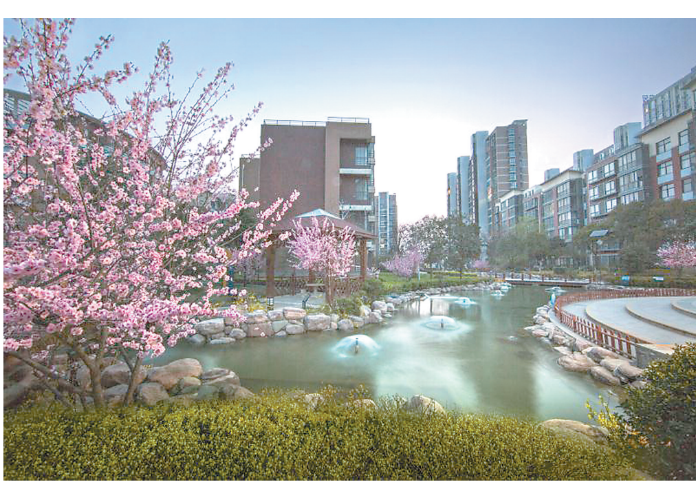
每周一楼景 猜猜它是谁

3.7,绿化率约35%,共规划建设5栋高层住宅。目前,6号楼即将达到交付标准,园区绿化工程正在进行中,3号楼外保温已完工,电梯正在安装中。