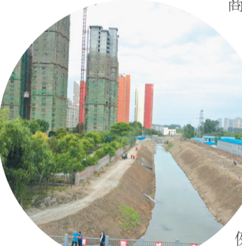
新河应急度汛工程。