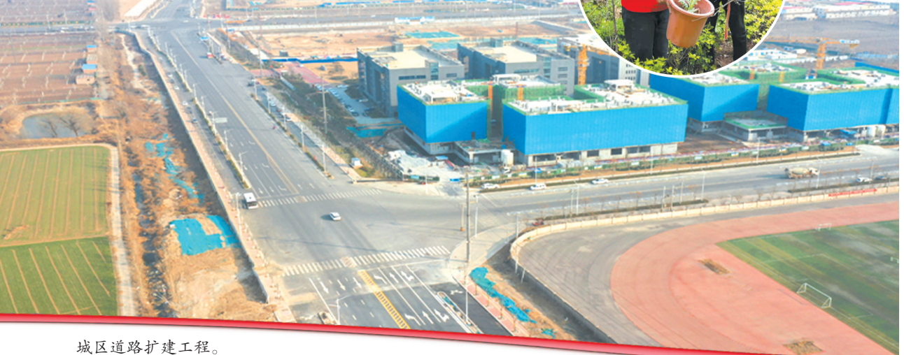
城区道路扩建工程。