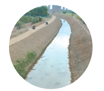
新河应急度汛工程。

“三零”创建取得新进展 深入开展“六防六促”,与公安、司法等部门建立联防联控机制和矛盾纠纷排查机制,化解各类矛盾57起。抓好普法宣教,制订各类宣传活动方案,开展“六进”专项活动,增强群众的法制意识。积极开展防溺水工作,对河堤沟渠进行常态化巡查,在小学、社区开展未成年人防溺水专题教育活动。反诈宣传的放矢,对河南理工大、芦堡、南李万周边及老年人开展防诈骗专题宣传。加强人民调解,成立了一支11名志愿者组成的调解员队伍,经专业培训后统一发放了聘书,完成积案化解任务,化解率83.3%。持续抓好安全生产,强化“五包”责任制,明确责任分工,定期开展了房屋、燃气、消防、用电等一系列安全排查整治。重点对南李万村房屋安全隐患成立了整治专班,投资40余万元建设集中充电车棚。组织开展防汛培训及应急演练,指导14个村居开展专项防汛演练。 民生福祉幸福指数提升 筑牢疫情防控防线,实现场所码全覆盖和督导检查常态化。周密安排核酸检测工作,防疫报备清零、重点人群核查和疫苗接种。助推“人人持证、技能河南”建设。联合人社部门开展形式多样的技能培训,开展各类培训班20个,培训人员500人。结合人居环境整治,开展多项爱国卫生运动,组织7个单位创建省、市级卫生单位。积极开展病媒生物防治,排查整治孳生地7000余处。持续巩固国家卫生城市基础档案规范化。惠民政策全面落实。扶助对象98%以上居民参保医保。做好救助困难群众补助金发放,确保高龄老人、优抚对象、低保人员、分散特困供养人员的补助金按时发放。完成辖区退役军人建档立卡和优待证申领系统录入工作。加强养老体系规范化建设,对现有的5个农村幸福院和2个社区日间照料中心,按照标准正常运营,为老年人提供暖心服务。持续打好蓝天保卫战,利用无人机等方式管控好烟花爆竹禁燃禁放,小散乱污动态清零等,PM 10 、PM 2.5 等指标多次位居全市前列。 能力作风实现新提高 以提升履职能力,敢于担当作为,锻造过硬作风,深入推进“能力作风建设年”活动。围绕作风建设“十问”和“三级倡树”开展作风自查,按照推进会列举的作风建设方面的十个问题和“三级倡树”各项要求,全体人员共同参与,立足工作职责,对照年度工作目标,深刻反思,在街道上下开展大学习、大研讨,单位和个人分别形成对照检查材料,建立专项整改台账,明确努力方向和整改措施,推动观念大更新、能力大提升、作风大转变。自觉抵制“四风”侵蚀,力戒形式主义和官僚主义,自觉接受各方监督。充分发挥纪委监督“探头”的作用,将各项中心工作纳入监督范畴,上半年共开展提醒谈话7人次,其中疫情防控问题2人次,环保问题2人次,信访问题3人次。持续开展“以案促改”,通过定期学习典型案例,勤打警示教育“预防针”,坚持用身边事教育身边人,实现党员干部全覆盖。深入开展以案促改,坚持把以案促改常态化学习放在工作中,通过班子会议、机关晨会和主题党日集中学习违纪违法典型案例,结合工作摆问题,真正做到知敬畏、守底线。深化“廉洁从家出发”,把廉洁家庭建设同廉洁组织、廉洁社会建设相融合,组织街道人员及家属开展“十不准”廉洁承诺书签订活动。