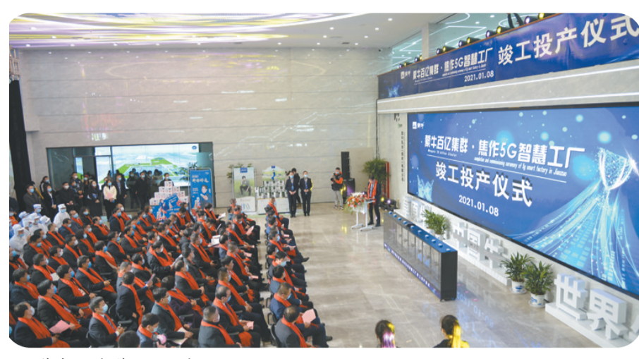
蒙牛5G智慧工厂投产。

核心提示 非凡十年,勇当排头。文苑街道坚定贯彻落实各级工作部署,紧紧围绕“25311”远景目标,用责任和担当交出一份亮眼成绩单。 一组经济数据彰显韧劲。今年前8个月税收收入库累计2.94亿元,同比增长25.9%。规模以上工业增加值增速8.1%,固定资产投资增速18.4%,社会零售总额增速2.8%……各项主要经济指标位列全区第一。 一项项先进荣誉见证荣耀。先后获得市污染防治攻坚战先进集体、市信访工作先进单位、市扫黄打非基层示范点、全区高质量发展先进单位、区“三个一批”工作先进单位、区“万人助万企”活动先进单位、区域建设先进单位等多项市区先进荣誉。