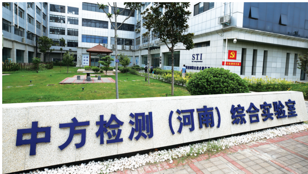
中方检测(河南)综合实验室。

非凡十年,科创第一。焦作高新区在市委、市政府的坚强领导下,牢固树立新发展理念,坚持把科技创新作为引领发展的第一动力,把科技综合体作为培育“三新”经济、集聚创新人才的重要平台,狠抓建设、管理、运营三个关键环节,着力打造更具活力的产业创新生态系统,大力发展楼宇经济、总部经济、研发经济等新业态,加快集聚研究开发、技术转移、检验检测认证、科技金融等服务机构,持续优化创业孵化生态,全面赋能产业发展,为全区新旧动能转化、区域协同创新发展增活力、添动力,全力打造科技创新高地。目前,全区拥有科技综合体6个,总建筑面积150万平方米,已建成41.8万平方米;拥有省级以上孵化载体9家,其中国家级科技企业孵化器1家、省级大学科技园1家、省级科技企业孵化器1家、省级众创空间6家,尤其是名仁众创空间为焦作市首家专业化众创空间,数量居全市第一位,入驻企业(团队)800余个,年纳税近2亿元。 征途风正劲,扬帆再起航。站在新起点,焦作高新区必将出重彩结硕果。