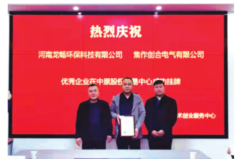
园区企业中原股权中心挂牌。

打造服务平台,实现资源共享,让企业专心搞创新。 该公司2006年被省科技厅批准为中小企业服务平台;2009年被省商务厅和工信厅联合批准为河南省国际服务外包基地;2011年被省工信厅批准为河南省中小企业公共服务平台;2012年,该公司顺利完成“面向光机电产业的中小企业公共服务平台”建设,并通过省科技厅专家组考核验收;2013年被省工信厅批准为焦作市信息化网络综合窗口服务平台;2015年12月,该公司被河南省院士专家工作促进会、河南省工业经济联合会、河南日报报业集团、河南省高新技术创业服务中心四家单位联合评为“河南省十佳科技园”;2020年11月被评为焦作第一批双创示范基地;2022年7月焦作高新技术创业服务中心有限公司被河南省科技