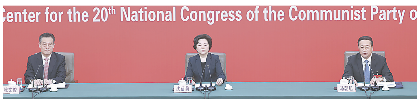
10月20日，中国共产党第二十次全国代表大会新闻中心举行记者招待会。中央对外联络部副部长沈蓓莉，外交部党委委员、副部长马朝旭围绕“习近平外交思想指引中国特色大国外交开拓前行”主题与记者交流。

新华社北京10月20日电 党的二十大新闻中心20日上午举行第四场记者招待会，中共中央对外联络部副部长沈蓓莉，外交部党委委员、副部长马朝旭两位二十大代表，围绕“习近平外交思想指引中国特色大国外交开拓前行”主题向中外记者介绍了有关情况，并回答记者提问。