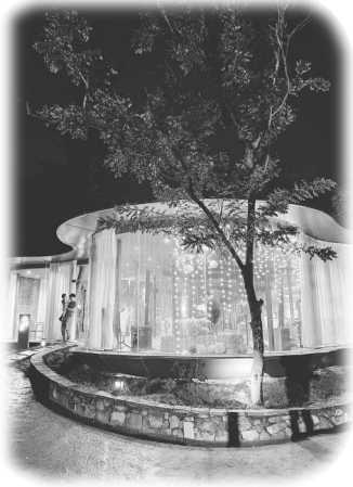
大南坡“老村小馆”夜景。许力撰

厚。老屋内的12棵古树也被完整地保存下来，曲线的玻璃边界和葫芦形的天井，都是为了绕开原有树木而产生的自然形态。“老村小馆”通过运用弧形玻璃和素土建筑等设计元素，营造出“屋檐下”“棚有台”“土山房”等不同功能的错落空间，使古意新宅更具审美意趣。 许力撰