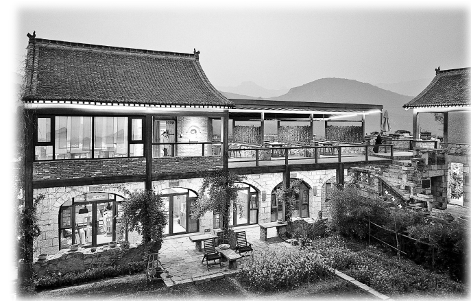
云上院子夜景。

分享，提出了不少可行性建议。 万物可研学！随着大研学时代的到来，全域全时全龄研学旅游体验正在不断丰富。 会议指出，要加大研学旅游资源挖掘力度。我市具有丰富的研学资源，北部的山地生态及地质资源，南部的黄河文化及湿地资源，以西大升、十二会、岩山等红色旅游资源访问点为代表的革命历史研学资源，以韩国、朱载堉纪念馆、李商隐纪念馆、何塘纪念馆等为代表的名人及国学传统文化研学资源等。要认真研究，充分发挥优势，发展科学合理、学科健全的研学产品体系，真正把资源优势发挥到最大功效，占据研学市场领地，实现焦作文旅产业新突破。 要注重研学营地的建设。要尽快规划建设高质量的研学营地，选取优良的具有教育属性的资源进行整合，探究教育性、实践性、公益性、安全性的保障体系，推动研学活动可持续、高质量发展。 要加强研学导师队伍建设。文旅与教育紧密结合，要联合我市大中专院校，进行研学导师专题培训，打造高素质专业化的研学导师队伍，发挥好研学旅游的育人作用，精心设计研学课程，真正达到旅教融合效果，让广大游客、大中小学生在研学实践中获得体验，增长见识，游中学、学中乐，促进我市研学旅游全面发展。