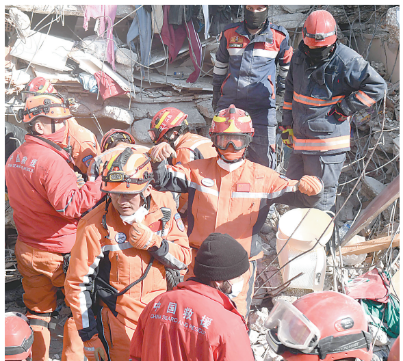
2月12日,中国救援队队员在土耳其哈塔伊省安塔基亚市一处地震废墟开展救援工作。据中国救援队最新消息,截至当地时间2月12日,中国救援队在土耳其地震重灾区哈塔伊省安塔基亚市已救出6名幸存者。

据新华社伦敦2月14日电(记者张亚东)美国汽车制造商福特公司14日宣布,未来3年将在欧洲地区裁员3800人,其中在德国和英国分别裁员2300人和1300人。 福特公司表示,通胀高企、利率和能源成本上升促使公司裁员,这样做或有助于福特“重振欧洲业务”。 业内人士认为,英国汽车市场不振和电动化转型也是福特实施裁员的重要原因。 英国汽车制造商和贸易商协会数据显示,2022年英国汽车产量较2021年下跌9.8%;与2019年相比,跌幅达40.5%。