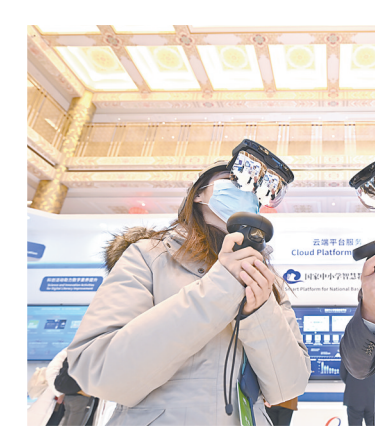
2月13日,一名与会媒体记者(左)在体验混合现实头盔。当日,世界数字教育大会在北京开幕。大会以“数字变革与教育未来”为主题,旨在推动我国教育数字化工作取得新进展,为世界数字教育发展注入新动能。