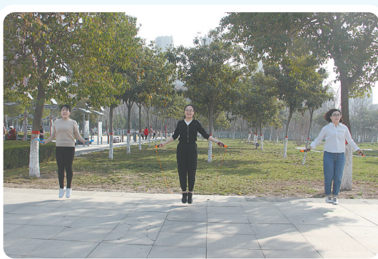
▲3月8日上午,市应急管理局开展三八国际妇女节趣味运动会。图为比赛现场。秦亚平 摄