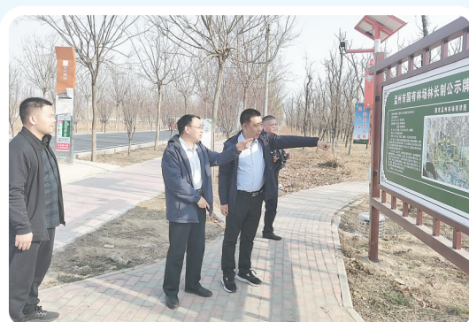
▲3月8日,市应急管理局第五督导组对国有孟州林场、孟州市大定街道办事处等地安全生产工作进行查看。