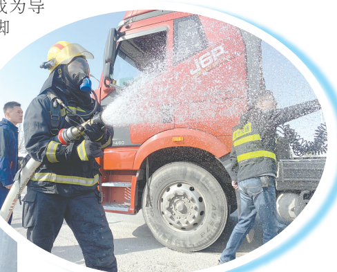
▲孟州市消防救援大队消防队员利用高压水枪对“事故现场”进行洗消。本报记者 贾定兴 摄 ▲焦作市应急救援协会队员正在进行单绳上升科目训练。本报记者 贾定兴 摄