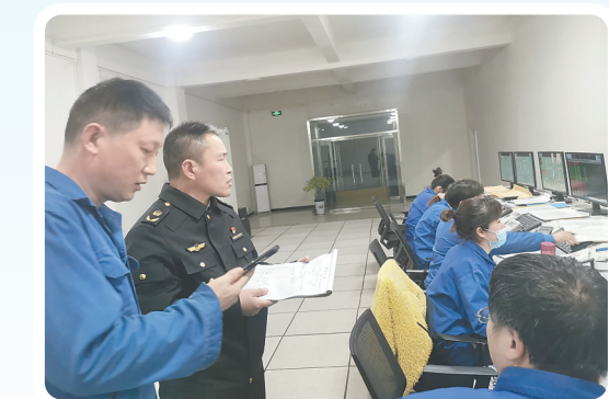
▲3月3日晚,市应急管理局危化检查组对焦作市祺祺清洁能源有限公司等4家企业开展突击夜查。

演练结束后,焦作市应急管理局副局长韩寿山带队到中原内配集团股份有限公司进行实地观摩,了解企业应急预案制订、应急处置及安全管理有关内容,并召开全市应急演练工作推进会,安排部署工作任务,指导完善预案体系,统筹协调救援队伍,全面提升抢险救援能力,确保我市应急救援力量关键时刻拉得出、冲得上、打得赢。