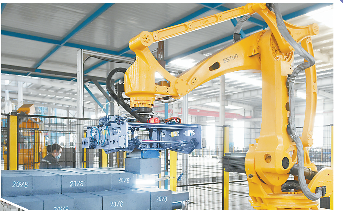
3月15日,位于博爱经济技术开发区的焦作鑫恒拓新材料股份有限公司机器人在生产耐火材料铁包砖。该公司是一家集研制、生产和销售各种定型、不定型耐火功能制品,并承担钢铁、有色、石化、电力等行业用耐火材料的设计、安装、施工、使用维护与技术服务为一体的整体承包企业,拳头产品锚固砖和高温空气燃烧器市场份额居国内首位,市场占有率75%以上。2022年,该公司克服疫情不利影响,仍然保持经营状况持续向好的态势,实现销售额4.5亿元,同比增长10%。