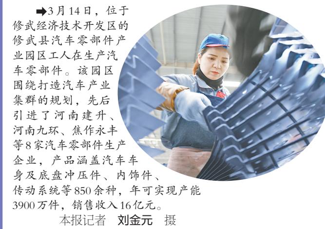
3月14日,位于修武县汽车零部件产业园区工人在生产汽车零部件。该园区围绕打造汽车产业集群的规划,先后引进了河南建升、河南九环、焦作永丰等8家汽车零部件生产企业,产品涵盖汽车车身及底盘冲压件、内饰件、传动系统等850余种,年可实现产能3900万件,销售收入16亿元。