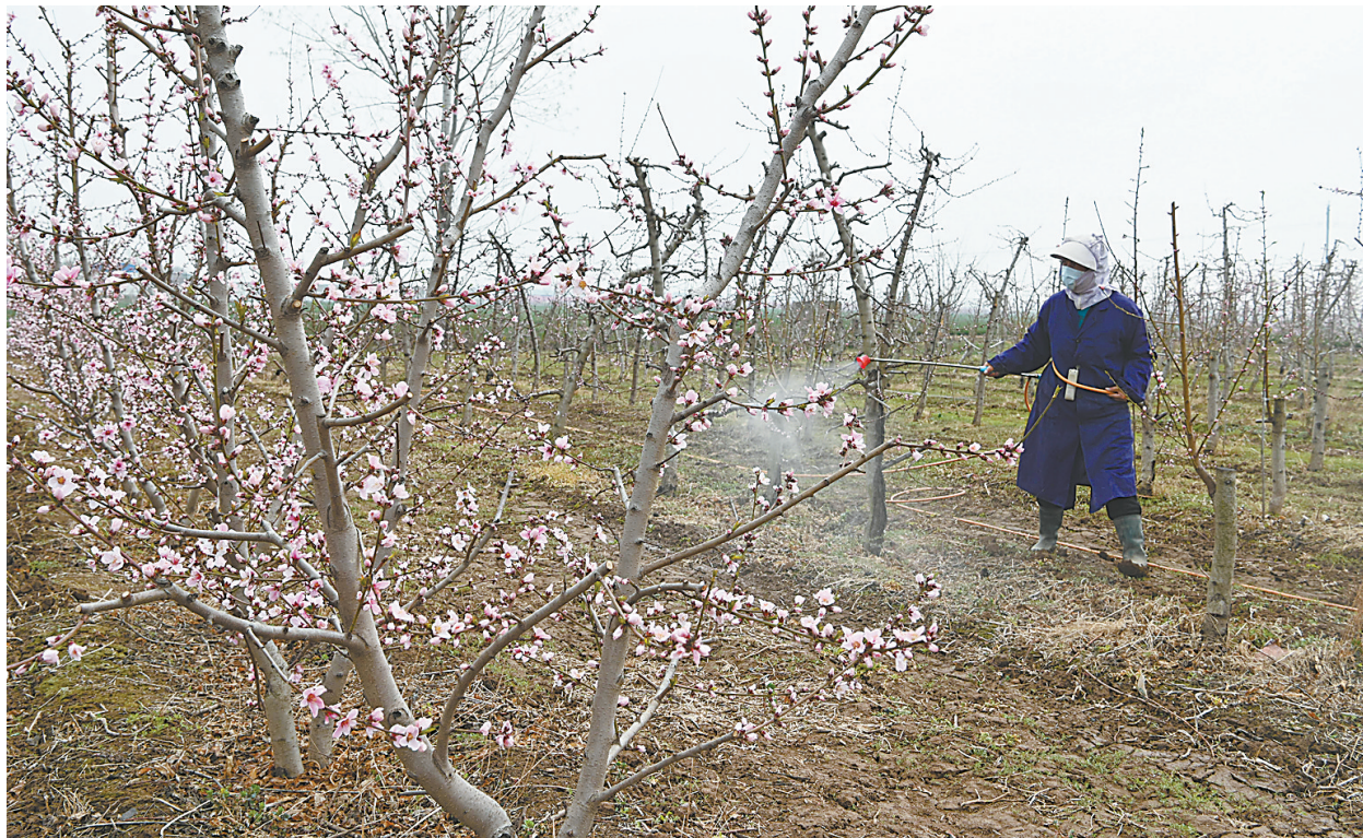
3月18日，沁阳市崇义镇赵儒村一处桃园，农民为桃树喷洒防治芽虫的药物。目前正是果园春季管理的关键时期，当地积极开展春季修剪、杀菌杀虫、浇水保墒、追肥、调理土壤、灌根增壮，为优质丰产奠定基础。

3月19日8时30分，一位戴着眼镜，手里拿着教案的中年人，文质彬彬地走上解放区焦北街道“名人堂”大讲堂，向大家深鞠一躬，开始娓娓讲述《金色鱼钩》《七根火柴》《半碗青稞面》等红军长征过程中的感人故事。台上主讲人讲得绘声绘色，台下听众听得真情融入，情到深处，台下听众不禁落泪，讲到精彩，台下听众鼓掌热烈。