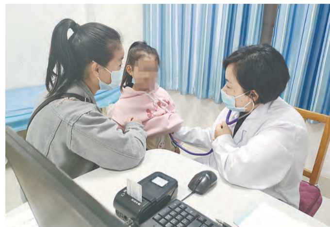
医生为儿童患者诊疗。

便利,该院成立了儿科病房区,能诊治儿童疱疹性咽峡炎、化脓性扁桃腺炎、支气管炎、支气管肺炎等呼吸道疾病,口腔溃疡、小儿腹泻合并脱水、急性胃肠炎等胃肠道疾病,以及手足口、水痘、流行性感冒等疾病,并配备婴幼儿心电监护仪、小儿电吸痰器、静脉推注微量泵及压缩雾化器等医疗设施,提供全天24小时儿童病房急诊服务。