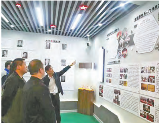
市中心血站团员青年参观市老干部英模事迹展。

长鸣”警示教育案例片。历经沧桑初心不改,饱经风霜本色依旧,这是每个团员青年在未来人生道路上都应做到的。 在讲解员的引导下,大家还参观了关心下一代工作委员会及其研学调研活动风采展,参观了老干部书画厅、阅览室、棋牌厅、健身厅及银龄保健室等学习活动场所。团员青年们纷纷表示,要接力传承、奋勇争先,在建功新时代的奋斗中贡献青春力量。