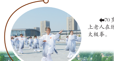
▲70岁以上老人在练习太极拳。