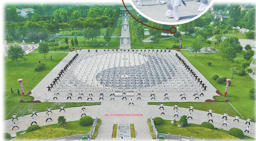
2017年9月，世界百城千万人太极拳展演活动中，陈家沟太极拳祖祠及博物馆广场聚集了众多太极拳爱好者同练太极拳。

落实市党代会精神，推动太极拳实现新发展，我们充满期待，我们大有可为。今天的我们，一定可以在太极拳的历史上，为全世界的健康事业贡献取之不尽的东方智慧，留下属于自己的浓墨重彩。