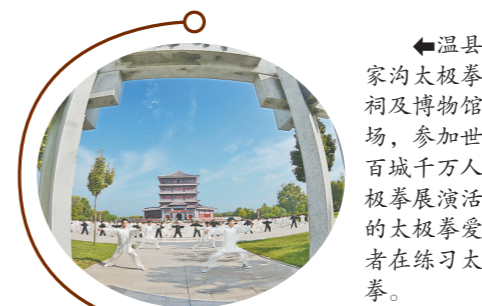
▲温县陈家沟太极拳祖祠及博物馆广场，参加世界百城千万人太极拳展演活动的太极拳爱好者在练习太极拳。