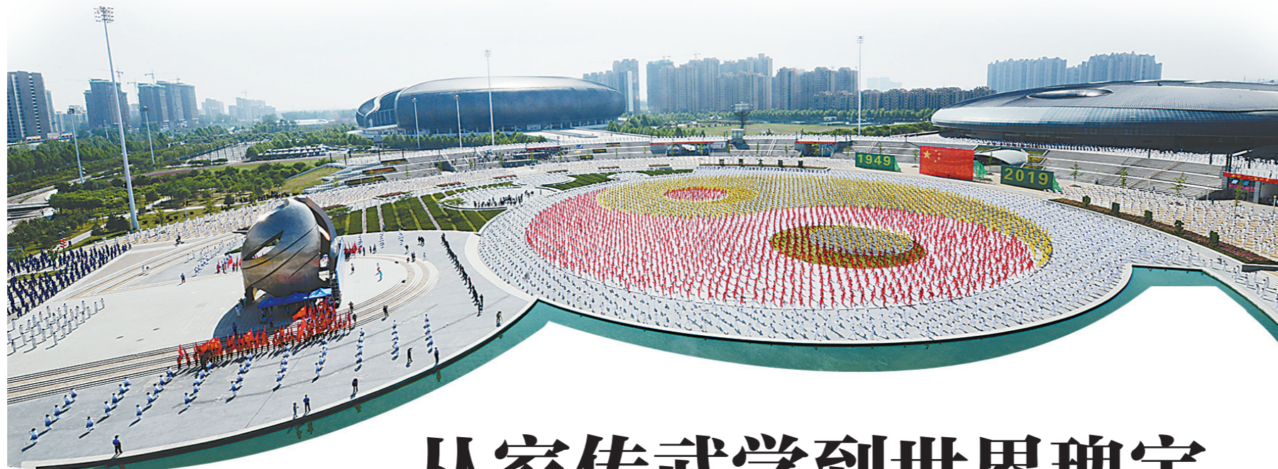
▲全国太极拳健康工程系列活动——2019年太极拳公开赛启动仪式现场。