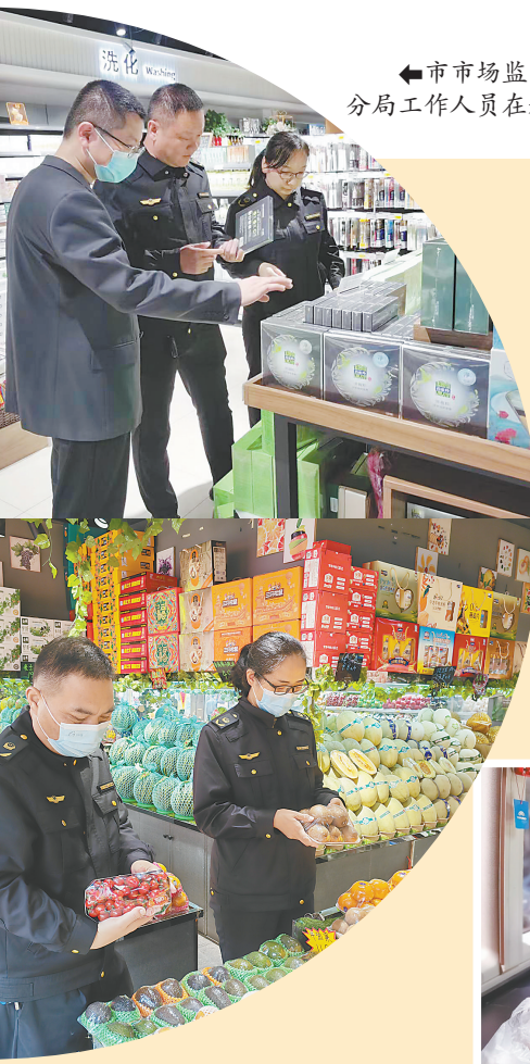
市场监管局示范区分局工作人员在超市巡查。