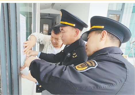
市场监管执法稽查支队为云台山景区部分民宿张贴价格秩序提醒告诫书。