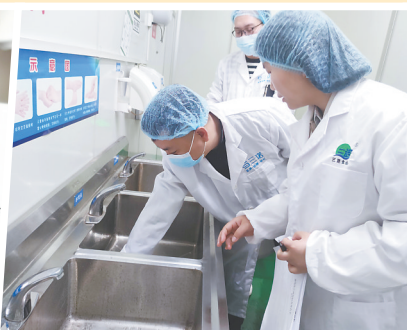
市场监管局示范区分局工作人员在企业检查食品安全。