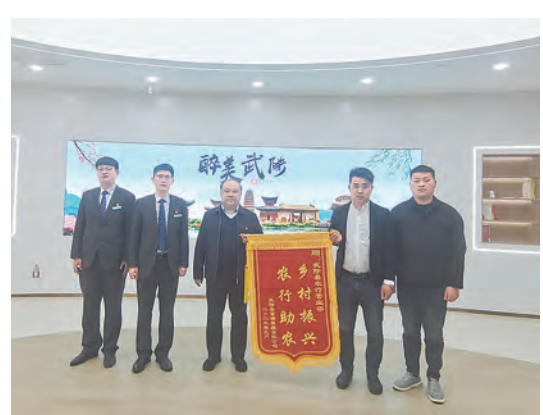
农行武陟支行以优质服务助力养殖农户致富增收。

本报讯(通讯员荆泽哲)近日,一名来自坊塔店乡的养殖农户将一面写有“乡村振兴 农行惠农”的锦旗送到农行武陟支行,以表达对该行信贷经理贴心服务的感谢和认可。