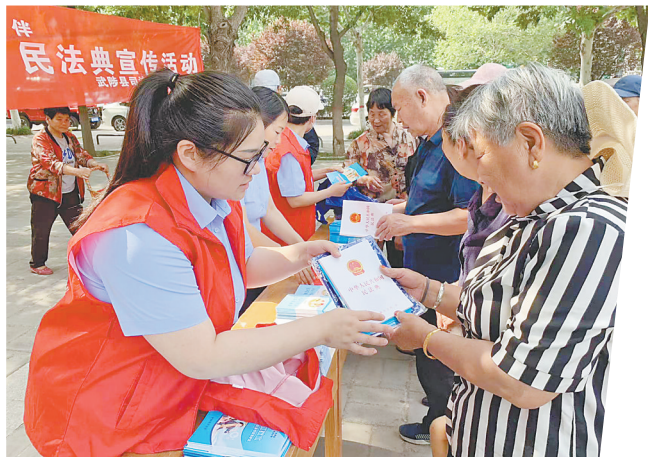
近日，武陟县司法局在县宪法广场开展以“生活多一‘典’ 幸福多一点”为主题的《民法典》宣传活动。