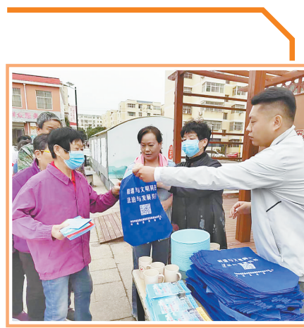
近日，中站区司法局王封司法所所在云台小区开展“美好生活·民法典相伴”主题宣传活动。