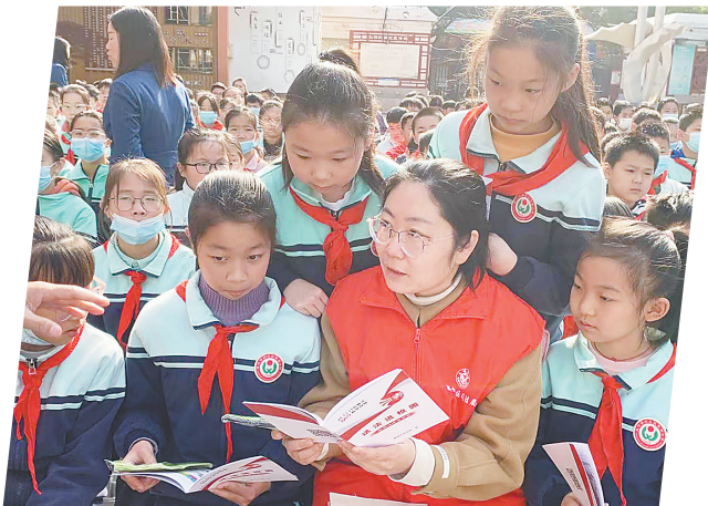
近日，解放区司法局焦西司法所走进焦西小学开展“法治宣传进校园”普法宣传活动。