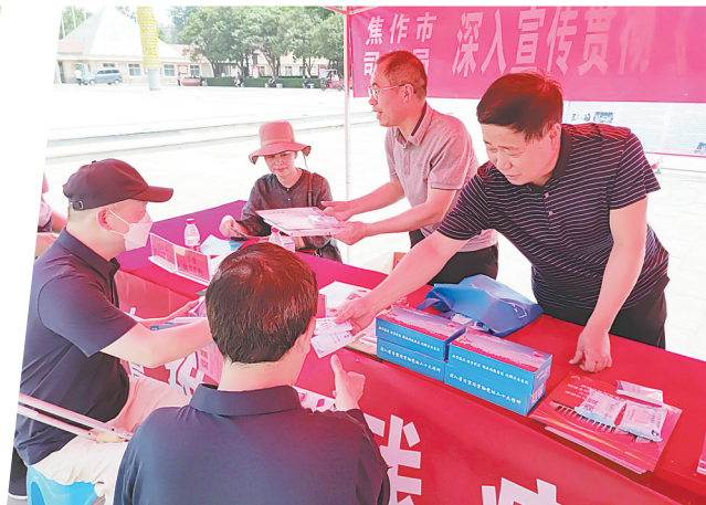
连日来，全市司法行政系统走上街头，围绕第三十三次全国助残日开展系列活动，鼓励社会各界理解、尊重、关心、帮助残疾人，促进残疾人事业全面发展。