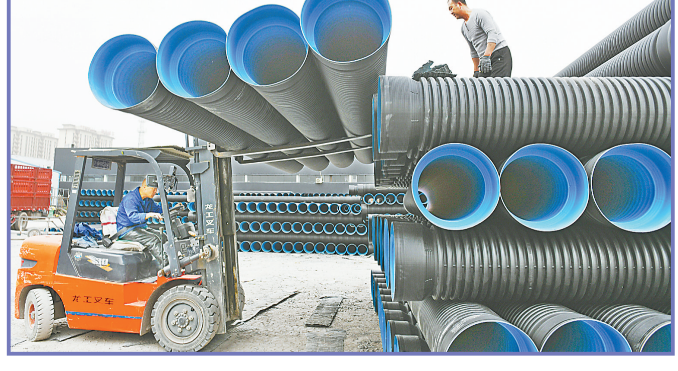
↓5月29日，河南锦润塑胶科技有限公司工人正在将排水管装车外运。该公司是一家从事工程管材生产的企业，经过发展壮大生产规模，目前已拥有国内先进的20余条特种管道生产线，年生产能力达3万吨，年产值达6000万元。