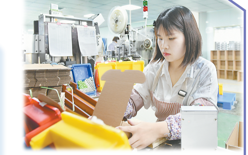
↑5月28日，位于修武经济技术开发区的焦作熠星电子科技有限公司工人在生产锂离子电池。该公司在锂离子电池储能、寿命和安全使用方面，技术水平处于国际领先。目前，年销售收入3.5亿元。