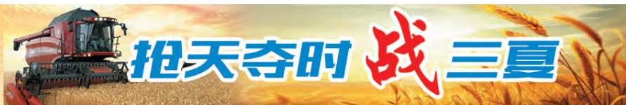
↓6月6日,在沁阳市西向镇义庄三街村的麦田里,履带收割机在收割小麦。