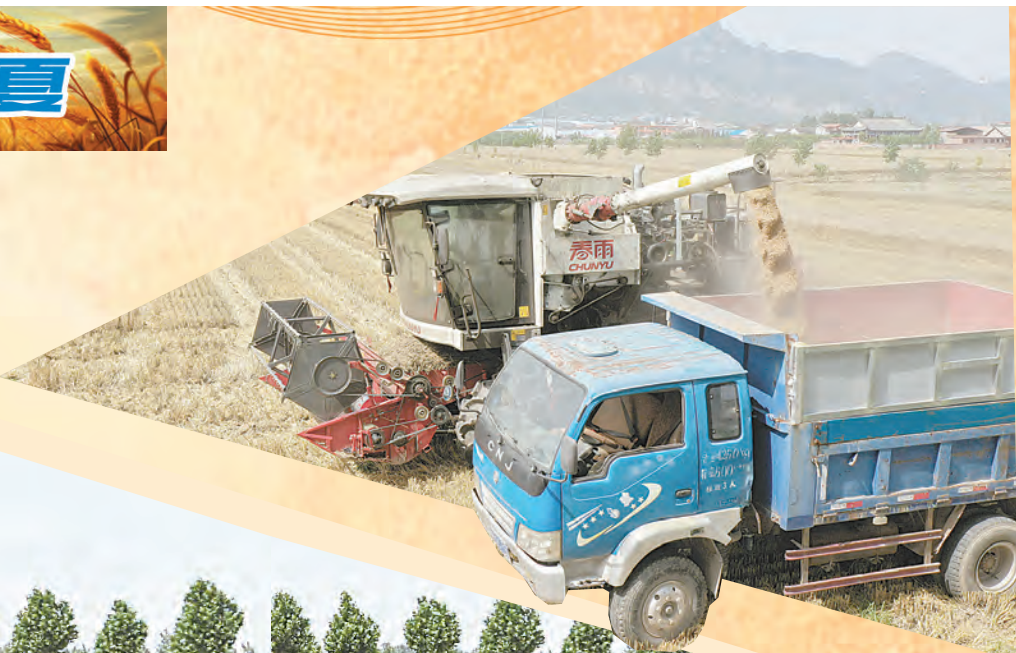
↑6月7日,在沁阳市紫陵镇东紫陵村,联合收割机收割的小麦随即装车外运。