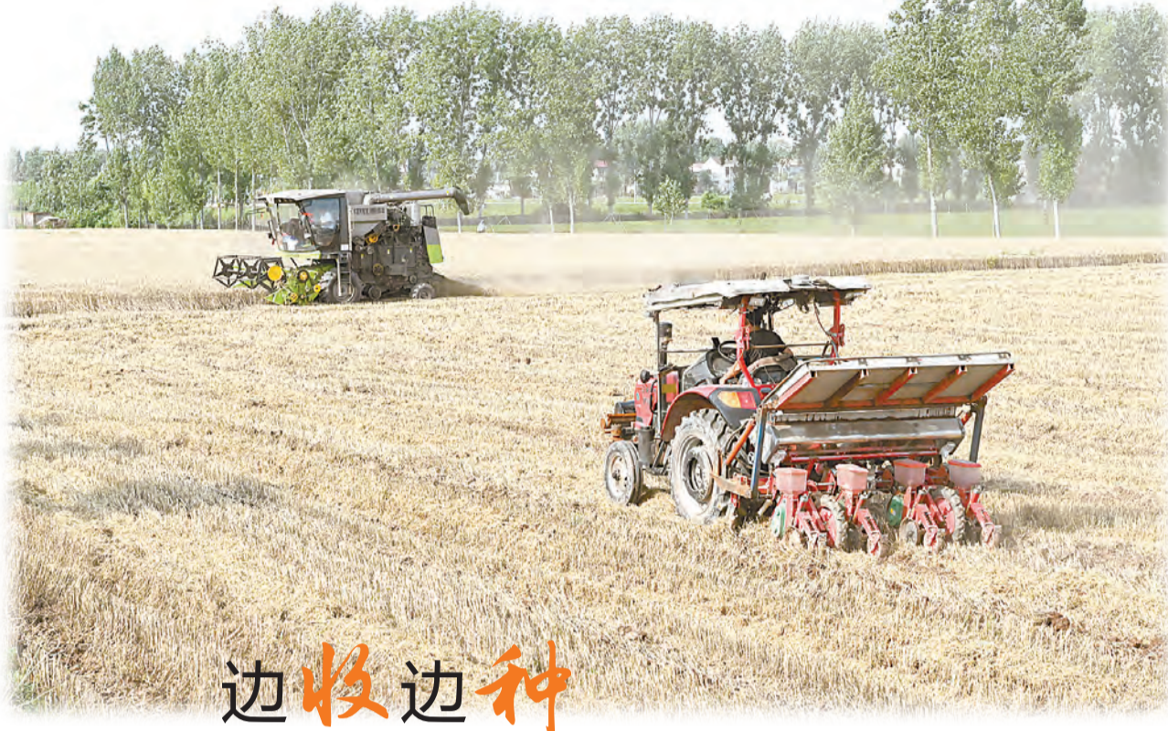
6月7日,沁阳市王曲乡南鲁村,农民一边收割小麦,一边播种玉米。

为助力“三夏”生产,做好“三夏”期间脱贫人口和监测对象帮扶工作,市乡村振兴局专门提前下发通知,强化精准帮扶,全市261个驻村工作队全部投入夏粮抢收工作。截至6月7日,全市共走访群众10235户,协调机械903台(次),帮扶困难群众2207户,帮助抢收小麦21213亩。