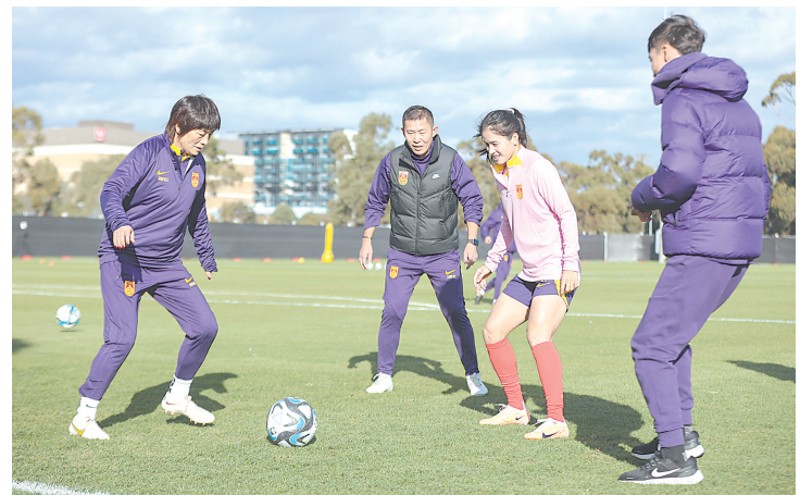
7月11日，中国队主教练水庆霞（左一）参与球员热身训练。当日，中国国家女子足球队继续在澳大利亚阿德莱德进行训练，备战将于7月20日揭幕的2023年女足世界杯。