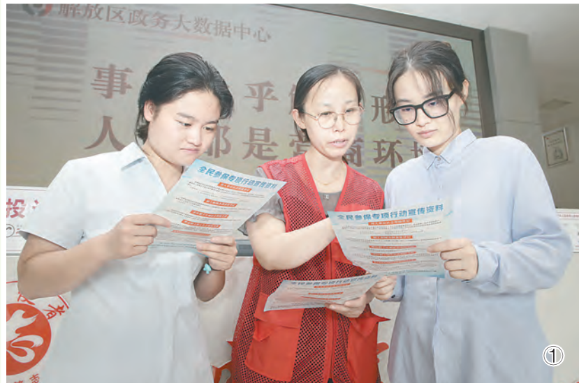
图① 7月11日,解放区企业养老保险中心工作人员正在向高校毕业生介绍就业岗位信息。近来,该区有关部门开通“就业参保直通车”,协调辖区100家企业为高校毕业生提供涉及交通运输、信息传输等多个行业的就业岗位3600个。

衡苑社区举办“幸福圆桌会”,将矛盾摆在桌面上,将诉求放在讨论中,把事情说明白、把政策讲清楚、把道理讲透彻,做到小事不出网格、大事不出社区,居民的幸福指数得到较大提升。