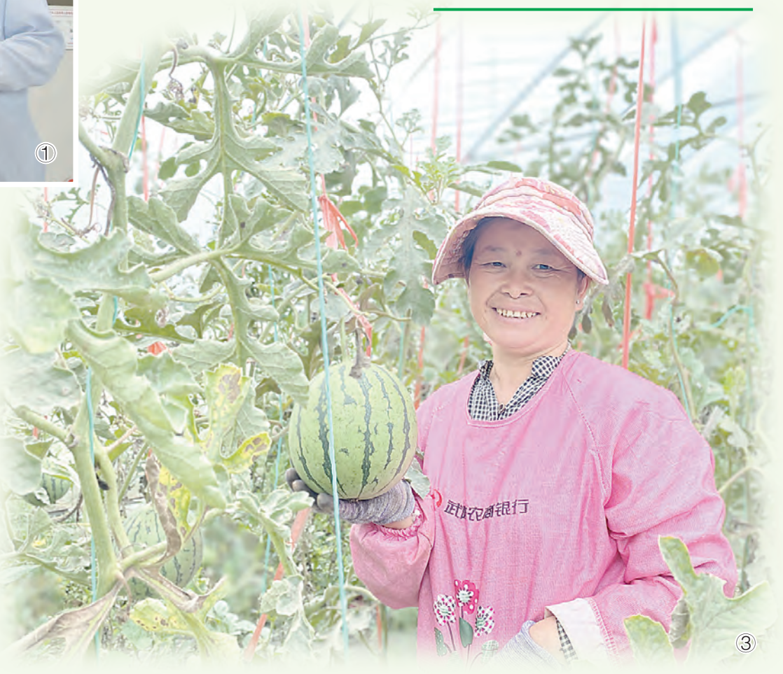
图③ 7月8日,在武陟县小董乡南王村鼎园家庭农场,瓜农在采摘西瓜。该农场现有11座西瓜种植大棚,为30名村民提供就业岗位,平均每人每年可增收1万元。