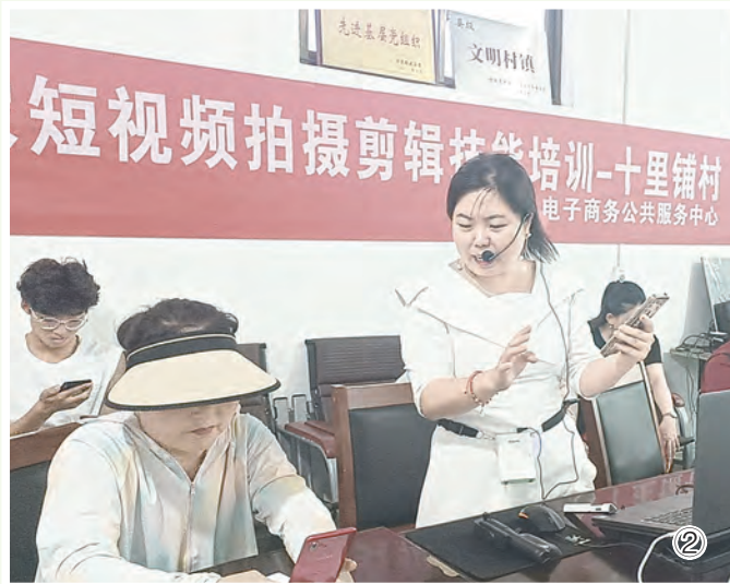
图② 7月5日,修武县自然资源局到帮扶村邵封镇十里铺村开展培训活动,邀请该县电子商务公共服务中心工作人员传授抖音短视频带货技能,40余名村民参加培训。