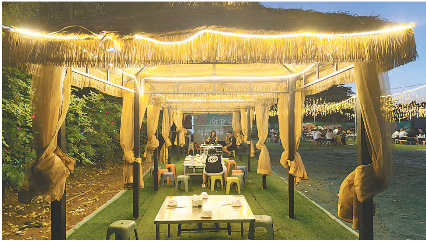
7月10日傍晚,在武陟县龙源街道东仲许村向日葵乐园,游客在休闲凉亭里用餐。

功夫不负有心人。在全村党员干部的共同努力下,昔日的废弃地、垃圾场,如今成了小花园、网红地,前来赏花打卡的人们漫步在花海中,边走边拍照记录,欣赏油画般的美景。