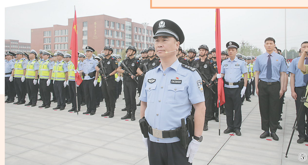
图① 处处见警。 图② 夜间巡逻。 图③ 查验酒驾。 图④ 普法宣传。 图⑤ 整装待发。