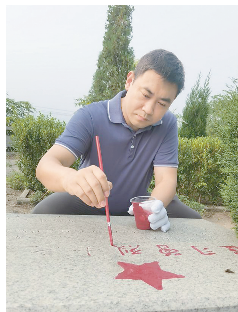
市退役军人事务局工作人员为烈士墓描红。