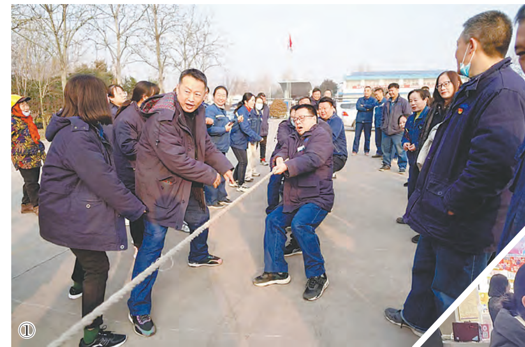
图① 2023年12月28日,焦煤集团冯营电厂工会举行了“喜迎新年 共谋发展”元旦系列活动,活动设置了长跑、拔河等比赛项目,让员工度过一个欢乐祥和的元旦佳节。图为拔河比赛现场。

范职工之家、职工小家、优秀工会工作者和省基层工会规范化建设示范点称号获奖名单,宣读了2023年焦作市基层工会规范化建设示范点和焦作市2021年-2023年厂务公开民主管理先进单位命名决定,并对相关代表进行了表彰。焦煤集团千业水泥有限公司、市追梦志愿服务中心等2家单位作了典型发言。