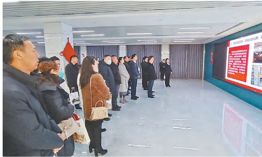
与会人员到武陟县供电公司实地观摩。

会议要求,各级工会组织要牢固树立服务意识、创新意识,拓展服务功能、破解场地难题、优化服务内容、打造工作品牌,不断推动各项工作任务落地见效,切实把工会组织建设成为职工信赖的“职工之家”。要强化服务意识,提高维权能力,改进工作作风,坚决克服机关化、脱离职工群众现象,让职工群众真正感受到工会是“职工之家”、工会干部是最可信的“娘家人”;要发挥基层工会贴近群众的特点优势,坚持以职工为中心,运用数字技术,实现职工普惠服务和精准服务相结合;要充实基层工会干部队伍力量,加强干部培训,激发工作热情,解决基层“缺人少编”等问题,打造一支具有良好素质的社会化工会工