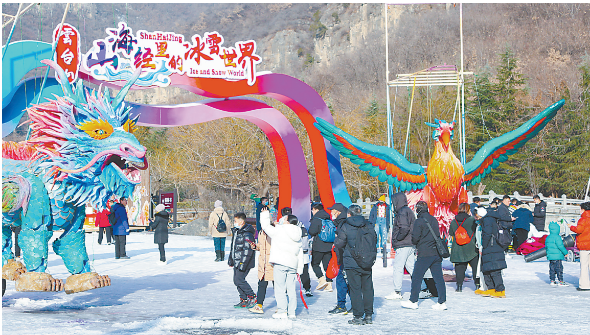
1月1日，云台山“山海经里的冰雪世界”主题冰雪节吸引了众多游客乘“冰”而来。随处可见的雪王、山海经里的异兽吸引着人们纷纷驻足打卡拍照，尽情赏冰乐雪，为市民和游客带来全新的冰雪消费体验。 本报记者 贾蓝 摄

本报讯（记者高小豹）近日，省水利厅等三部门联合公布2023年河南省省级节水型企业、单位、小区名单，我市喜添7家省级节水型企业、6家节水型单位，另有2家企业、1家单位、2家小区通过节水载体复核。这13家新创节水载体为：大咖国际食品有限公司（企业），河南省武陟县广源纸业（企业），国药集团容生制药有限公司（企业），河南晶能电源有限公司（企业），蒙牛乳业（焦作）有限公司（企业），杨掌柜食品科技（河南）有限公司（企业），中铝中州铝业（企业），国家税务总局焦作市税务局（单位），国家税务总局焦作市山阳区税务局（单位），国家税务总局修武县税务局（单位），国家税务总局孟州市税务局（单位），博爱县职业中等专科学校（单位），温县财政局（单位）。5家复核通过的节水载体为：风神轮胎股份有限公司（企业），河南超威电源有限公司（企业），焦作市机关事务中心（单位），修武县博喧宁城尚景小区（小区），修武县森林半岛小区（小区）。近年来，我市始终坚持“节水优先、空间均衡、系统治理、两手发力”的治水思路，高度重视工业园区、企业、学校、单位、小区等各类节水载体建设，并以创建节水型载体为契机，增强企业等用水户的节水意识和实践力度，成功培育大量的行业节水标杆和先进示范典型。