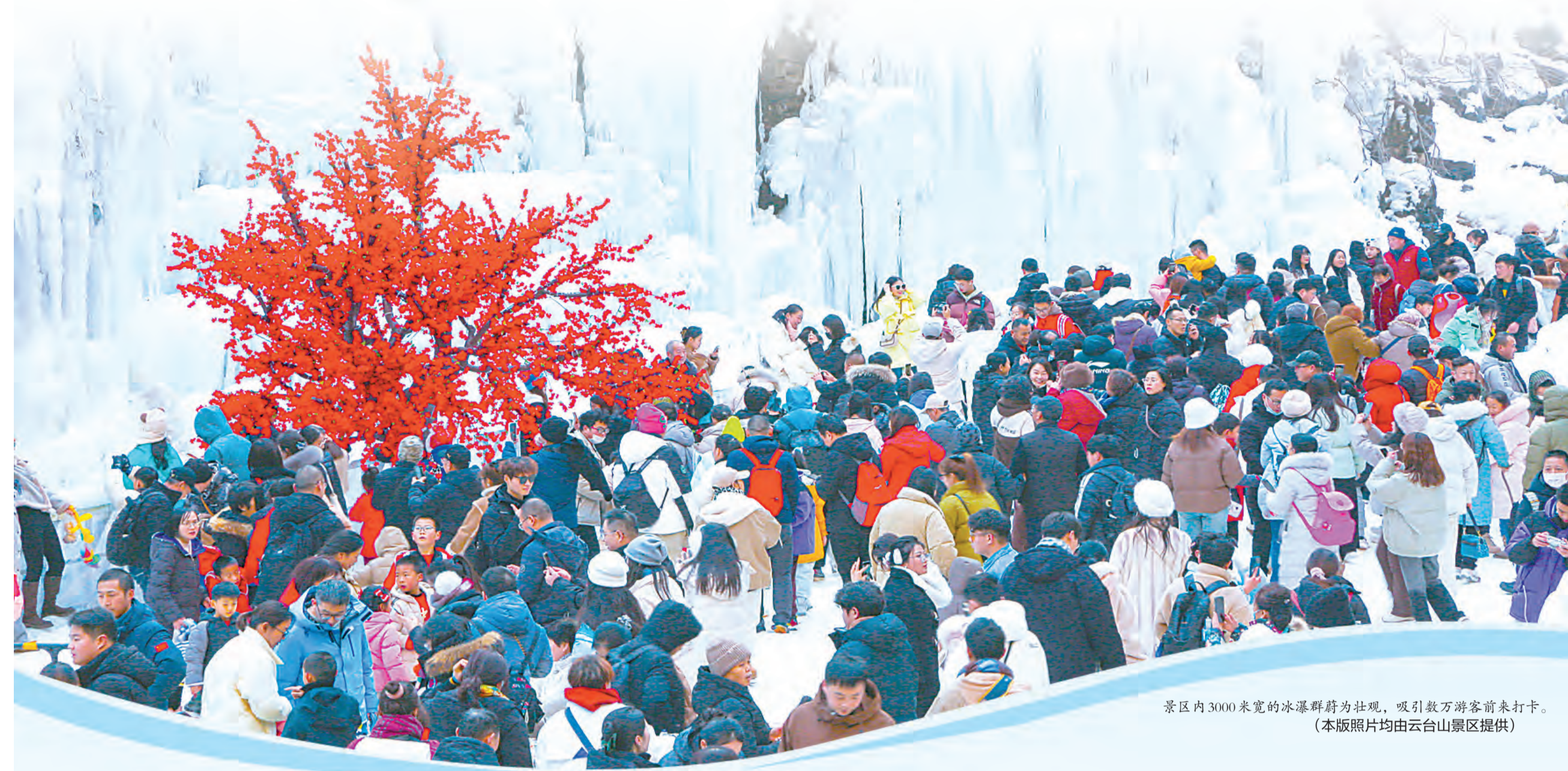
景区内3000米宽的冰瀑群蔚为壮观，吸引数万游客前来打卡。